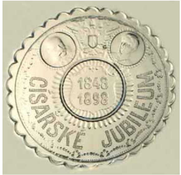
Abb. 2003-3/043 Kaiser Franz Joseph I. von Österreich, Altersbildnis 1898