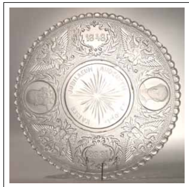
Abb. 2003-3/041b Andenken-Teller Kaiser Franz Joseph I. von Österreich Aufschrift im Spiegel „ANDENKEN a. d. 50jähr. KAISER JUBILAEUM“ u. Ordensstern auf der Fahne vier Doppeladler und zwei Wappen „1848“ bzw. „1898“, dazwischen Jugendbildnis, Altersbildnis, beide mattiert, Rand mit Perlen farbloses Pressglas, D 14,7 cm Sammlung Geiselberger PG-720 Herst. unbekannt, vielleicht S. Reich & Co., Krásno, 1898