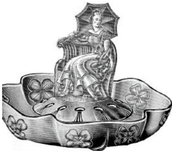
Abb. 2002-3/165 Aufsatzschale mit Figur „Shamrock“, Nr. 45950, Blumenblock Nr. 45952 Figur H xxx cm, rosé, grün, blau, mattiert Musterbuch Walther 1936, Tafel 8

Shamrock Nr. 45950 Tafelaufsatz, 3 fig. - Surtout de table, 3 pcs. - Centre-piece, 3 pcs. - Centro de mesa, 3 pcs. Höhe - Hauteur - Height - Altura 25 cm Gewicht - Poids - Weight - Peso 3500 g 418.- Nr. 45951 Schale - Coupe - Bowl - Fronte ø 34 cm Gewicht - Poids - Weight - Peso 1800 g 220.- Original-Paket 2 Stück pro Farbe Nr. 36200a Figur - Statuette - Figure - Estufa Gewicht - Poids - Weight - Peso 1000 g 110.- Original-Paket 2 Stück pro Farbe Nr. 45952 Blumenblock - Pique-fleurs - Flower-holder - Portaflores Gewicht - Poids - Weight - Peso 700 g 98.- Original-Paket 4 Stück pro Farbe Packung - Embolaje - Packing - Embalaje 48 Satz - Series - Sets - Juegos Br. 200 kg, Net. 100 kg = 0,90 cbm Farben: rosé, grün, blau