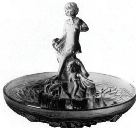
Abb. 2002-3/139 Tafelaufsatz Figur „Flötenspieler“, Nr. 42038 b Musterbuch Walther 1934, Tafel 76

Nr. 42038 Aufsatz „Flötenspieler“ , 3 teilig, teilweise überpoliert Surtout, 3 pièces, partiellement poli - Centre-piece, 3 pieces, partially polished Centro de mesa en 3 partes, en parte pulido Nr. 42038a Schale „Wasserlilien“, außen matt - Coupe à fleurs matée extérieurement Bowl, outside matted - Ensaladera por fuera mate ø 34 cm Nr. 42038b Figur - Statuette - Figure - Figura Höhe - Hauteur - Height - Altura 23 cm Nr. 42038c Blumenblock mit 12 Löchern - Pique-fleurs à 12 trous Flower-inset with 12 holes - Portador de flores con 12 agujeros ø 15 cm Lieferbar in den Farben: weiß, azurblau, rosé, grün. Livrable dans les couleurs: blanc, bleu-azur, rosé, vert.