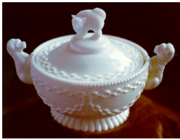
Abb. 2002-5/137 Deckeldose mit Katze als Griff und zwei Hunden opak-kalk-weißes Glas, H 14 cm, D 11,4 cm aus Chiarenza 1998, S. 144, Nr. 337 Musterbuch Davidson, um 1885, Nr. 26