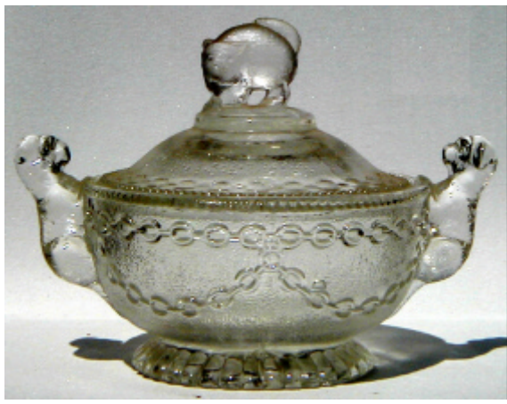
Abb. 2002-5/139 Deckeldose mit Katze als Griff und zwei Hunden farbloses Pressglas Sammlung Geiselberger PG-287, H 8,2 cm, Dose D 11,9 / 16,5 cm s. Preis-Kurant Preß-Glas Inwald 1914, Zucker- und Butter- dosen, Nr. 5714