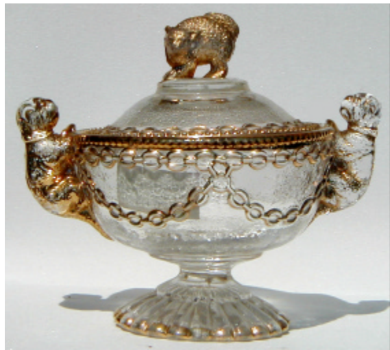
Abb. 2002-5/138 2 Deckeldosen mit Katze als Griff und zwei Hunden farbloses Pressglas, teilweise vergoldet Sammlung Geiselberger PG-135, H 9,2-9,4 cm, Dose D 11,7 / 16,2-16,8 cm s. Preis-Kurant Preß-Glas Inwald 1914, Zucker- und Butter- dosen, Nr. 5712 vgl. Chiarenza 1998, S. 144, Nr. 337, Dose mit Katze und Hunden, opak-kalk-weißes Glas, Davidson, Musterbuch um 1885, Nr. 26