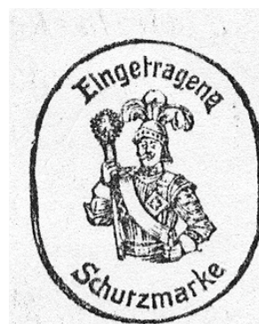
Abb. 2002-5/035 Musterbuch Streit 1913, Einband Eingetragene Schutzmarke „Ritter mit Stachelkeule“ Sammlung Feistner

Dass die Serien aus den Musterbüchern der Fa. von Streit in den Musterbüchern anderer Glaswerke (soweit sie bis jetzt bekannt sind) nicht auftreten, zeugt davon, dass die Großhändler von Streit nach eigenen Entwürfen fertigen ließen. Dadurch kommt es auch zu kleinen Unterschieden in der Rittermarke und in Details der Muster, z.B. bei Mäandern und Rosetten. Das dürfte auch eine Erklärung dafür sein, dass anstelle der Rittermarke eine Rosette nachträglich eingearbeitet wurde (Abb. 2002-3/124). Die Rittermarke, später nur als Aufkleber,