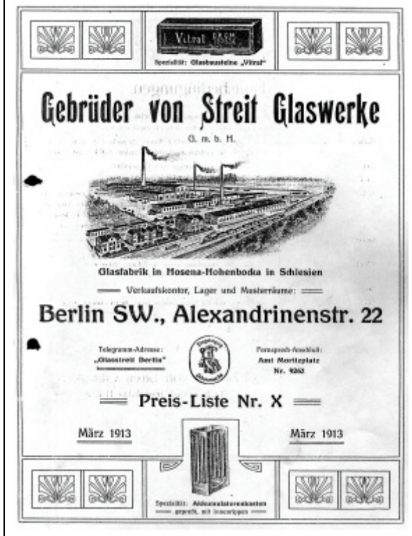
Abb. 2002-5/034 Preis-Liste Nr. X der Gebrüder von Streit Glaswerke GmbH, März 1913, Einband / Titelblatt