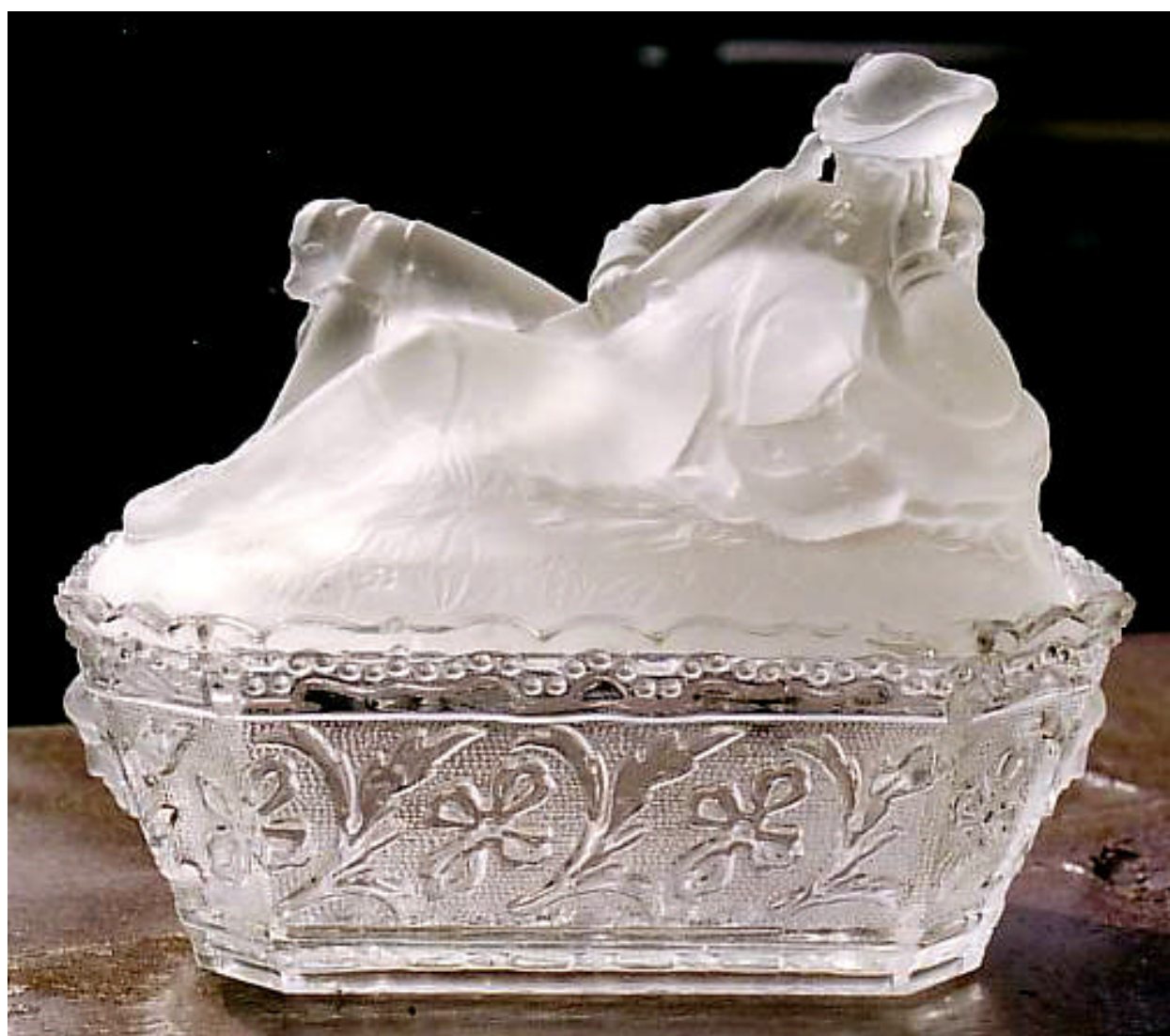
Abb. 2003-2/141 Zuckerdose „Liegender Jäger“, Deckel und Unterteil, farbloses Pressglas, mattiert, Figur H 8,5 cm, B 10 cm, L 15 cm, Unterteil Dose H 8 cm, L 16,5 cm, H m. Figur 16,5 cm, Slg. Zeh, Stopfer u. Neumann, s. MB S. Reich & Co. Mai 1873, Tafel 28, Nr. 2118