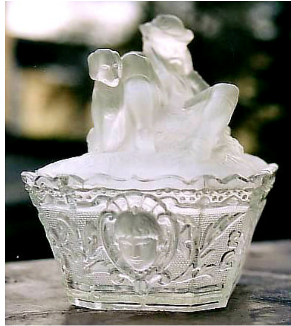
Abb. 2003-2/146 Zuckerdose „Liegender Jäger“, Unterteil Schmalseite farbloses Pressglas, mattiert, H 8 cm, B xxx cm, L 16,5 cm Sammlung Zeh s. MB S. Reich & Co. Mai 1873, Tafel 28, Nr. 2118