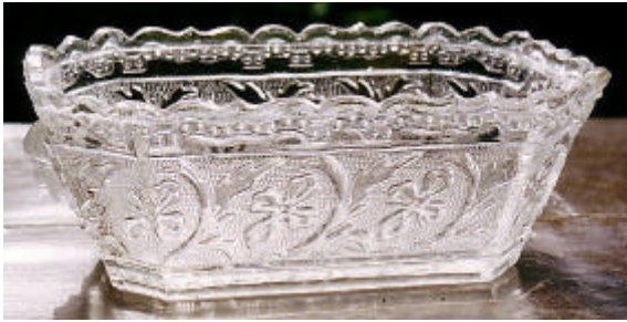
Abb. 2003-2/143 Zuckerdose „Liegender Jäger“, Unterteil von unten farbloses Pressglas, mattiert, H 8 cm, B xxx cm, L 16,5 cm Sammlung Zeh s. MB S. Reich & Co. Mai 1873, Tafel 28, Nr. 2118