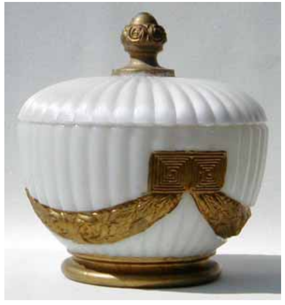
Abb. 2003-4/296 Deckeldose m. senkrechten Rundrippen, 3 Girlanden m. Rosen u. Lorbeer-Blättern, 6 Mäander weiß-opakes Pressglas, opaleszierend, m. goldener Kalt- bemalung, H Dose 7,1 cm, H Deckel 5,2 cm, D 11,4 cm Sammlung Geiselberger PG-592 Hersteller Glashütte Fenne, Saarbrücken, um 1900 MB Fenne 1903, Tafel 134, Zuckerdose "Alma" bzw. "Bru- no" Nr. 1356; MB Fenne 1909, Tafel 46 u. 47, Zuckerdose "Alma" Nr. 366, 378, 379, 380

Es wäre eigentlich schade, wenn die Deckeldose „Alma / Bruno“ von Fenne mit ihrer seiden-artigen Oberfläche und den kalt vergoldeten Art Deco-Rosen hier nicht abgebildet würde! Hier ist sie: