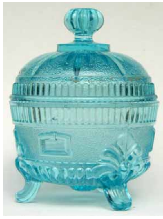
Abb. 2003-4/293 Deckeldose Nr. 3460 Grec u. Nr. 3458 Egyptien MB Portieux 1894, Planche 184, Sucrriers Nr. 3460