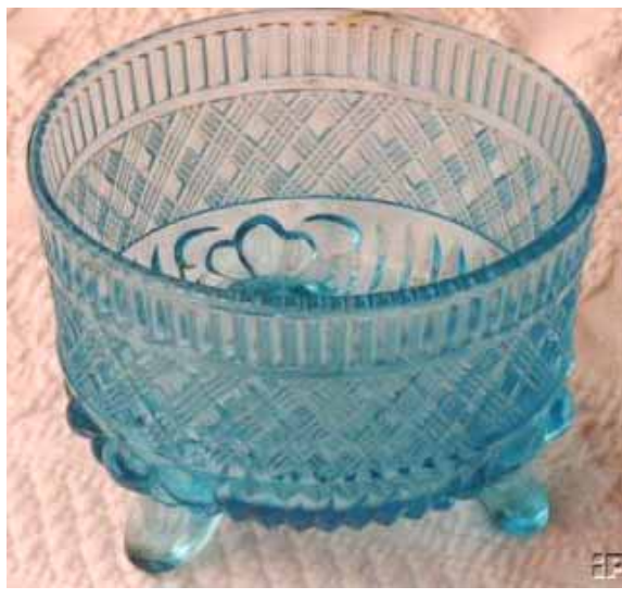
Abb. 2003-4/290 Deckeldose m. Flecht-Dekor, hellblaues Pressglas Auktion eBay Juli 2003 s. MB Meisenthal 1927, Tafel 81, Dose „Renaissance“

Alle drei Deckeldosen könnten also aus Meisenthal kommen. Sie könnten aber auch von der Manufacture Royale en Cristaux de Bayel / Fains gemacht worden sein. Die Silhouette ist sehr ähnlich, die senkrechten Rillen am oberen Rand des Bodens gibt es auch bei der hellblauen Dose und die schrägen Linien könnten das Gitter darstellen.