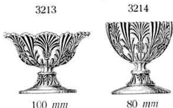
Abb. 1998-1/004 b Fußschale mit Distel-Muster Schaft und Nodus als Distel-Blüte (nicht verdreht) Sammlung Geiselberger PG-306 opak-hellblaues, opalisierendes Glas, H 9,4 cm, D 10,7 cm in der Mitte der Schale ring-förmig „VALLERYSTHAL“ farbloses Glas, H 9,4 cm, D 10,7 cm, ohne Marke vgl. MB Vallérysthal 1907, II. / Seite 231, Folios 227, 228 et 229, „CORBEILLES“, Nr. 3697 u. Nr. 3698

Abb. 2003-2-05/028 Pressglas-Kurant S. Reich & Co. 1925 Tafel 23, Salzvasen (Ausschnitt) Sammlung OVM Vsetín / Valašské Mezirící Inv.Nr. 60/03