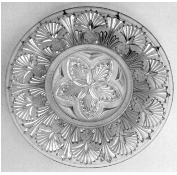
Abb. 1999-2/150 Schalen mit Distel-Muster, Rand ein- bzw. aufgetrieben aus Stenger 1988, S. 279, Musterbuch Vallerýsthal, 1907 II. / Seite 231, Folios 227, 228 et 229 „CORBEILLES“ [Korb, Körbchen] Nr. 3697, Größen 220, 200, 180, 140, 100 m/m und Nr. 3698, Größen 235, 220, 190, 150, 115 m/m