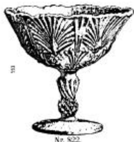
Abb. 1988-1/004 a Fußschale mit Distel-Muster Schaft und Nodus als Distel-Blüte (verdreht) aus Franke, Pressglas, Abb. 440 Musterblätter aus Kastrup, Plan D, Nr. 5 (Ausschnitt) Sukkerstel Nr. 822, H 11 cm, D 12,5 cm

Im Pressglas-Kurant S. Reich & Co. Wien - Krásno 1925, Tafel 23, Salzvasen, werden 3 Gläser mit Distel-Muster abgebildet. Der Fuß unterscheidet sich deutlich von den Gläsern aus Vallérysthal, die Schale könnte man aber verwechseln.