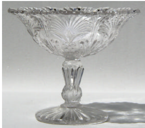
Abb. 2003-2/183 Fußschale mit Distel-Muster Sammlung Geiselberger PG-589 farbloses Glas, H 12,5 cm, D 10,7 cm ohne Marke, Hersteller unbekannt

Abb. 1998-1/004 b Fußschale mit Distel-Muster Schaft und Nodus als Distel-Blüte (nicht verdreht) Sammlung Geiselberger PG-306 opak-hellblaues, opalisierendes Glas, H 9,4 cm, D 10,7 cm in der Mitte der Schale ring-förmig „VALLERYSTHAL“ farbloses Glas, H 9,4 cm, D 10,7 cm, ohne Marke vgl. MB Vallérysthal 1907, II. / Seite 231, Folios 227, 228 et 229, „CORBEILLES“, Nr. 3697 u. Nr. 3698