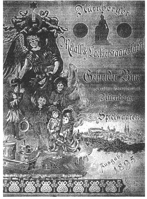
Abb. 2003-3/371 Musterbuch Nürnberger Metall- & Lackierwarenfabrik vormals Gebrüder Bing, A.-G., Nürnberg, 1895, Einband Spezialität feine Spielwaren