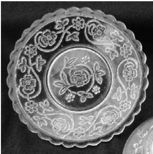
Abb. 2003-3/353 Teller m. Blütenranken farbloses Pressglas, D 8,1 cm Sammlung Gilbert, Hersteller unbekannt