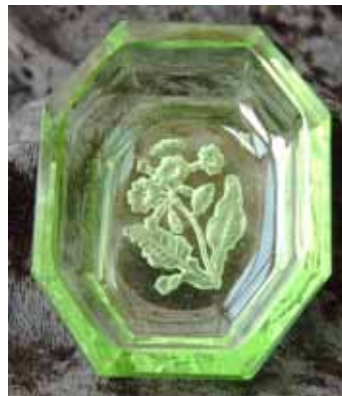
Abb. 2003-3/349 Fußschale m. Henkeln farbloses Pressglas, H 5,2 cm, B 5,5 cm, L 9,2 cm m. H. Sammlung Gilbert, Hersteller unbekannt