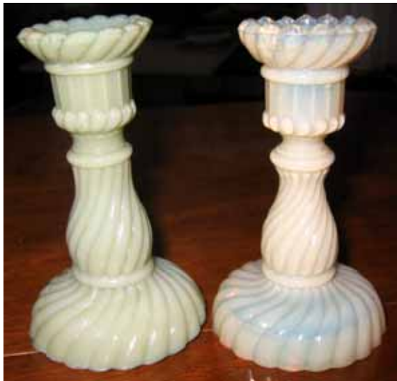
Abb. 2004-1/321 Leuchter, Sammlung Valentin gemarkt mit „SV“, Hersteller unbekannt

Mitten in der Nacht werde ich wach. Ein Blick auf den Wecker - 4.00 Uhr - . Stimmt, wir wollen ja nach Metz. So früh von alleine aufzuwachen, ist besser als per Radio geweckt zu werden. Ich genieße die letzten 5 Minuten im warmen Bett. Jetzt aber raus. Pünktlich um 6 Uhr müssen wir in den Hallen in Metz sein. Das Frühstück mundet schon, aber wegen der nächtlichen Uhrzeit müssen wir auf knackigen Flute und frische Croissants verzichten. In Erwartung der vielen Flohmarktexponate fällt uns das aber nicht schwer.