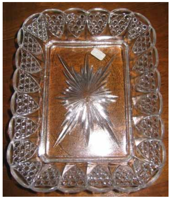
Abb. 2004-1/322 Schale, Sammlung Valentin gemarkt mit „SV“, Hersteller unbekannt

Um 8 Minuten vor 6 Uhr gehen wir vor den Hallen in Parkposition. Längst sind wir nicht mehr allein. Vor dem Eingang zu den Hallen hat sich eine große Menschentraube gebildet, alle warten auf Einlass. Das lässt mir Zeit zu Beobachtungen. Die Menschen um mich herum sehen ziemlich verschlafen aus, die Männer sind teilweise unrasiert, manche haben ihre Hände tief in den Taschen vergraben, andere plaudern ruhig mit ihren Begleitern. Bei den Frauen täuschen zart aufgelegtes Rouge und Lippenstift genügend morgendliche Frische vor. Man spürt eine eigentümliche ruhige Unruhe. Wir stehen etwas zurück und so kann ich beobachten, wie