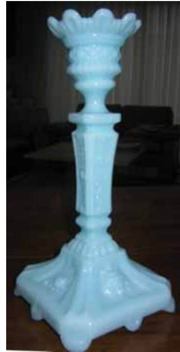
Abb. 2004-1/324 Leuchter mit „Löwenkopf“ Sammlung Valentin gemarkt mit „SV“, Hersteller unbekannt

und Decken auf dem Boden ausgebreitet. Wohlsortierte Stände wechseln mit auf dem Boden liegenden Kleiderbergen ab. Manches unsehenswerte Untergestell verschafft sich durch einen samtartigen Überwurf und sauber polierte Exponate Aufmerksamkeit. Andere Händler stellen die mit der Zeit schwarz gewordenen Silberleuchter einfach auf den kahlen Betonboden, neben allerlei Krimskräms oder auch zu besseren Artikeln aus Haushaltsauflösungen.