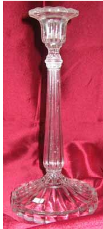
Abb. 2004-1/326 Leuchter „Else“ farbloses Pressglas, H xxx cm, D xxx cm Sammlung Valentin s. Musterbuch Fenne, um 1909/1910, Tafel 39, Seite 79 Leuchter, Nr. 301, „Else“, 26,5 cm

Mein Blick fällt auf das Gesicht des Händlers. „Ah, bonjour monsieur.“ Wir reichen uns die Hand. Von diesem Herrn weiß ich nur, dass er Pressgläser von Meisenthal sammelt. Unsere erste Begegnung war vor etwa 2 Jahren auf einem Flohmarkt in Saarlouis, damals hätte er mir beinahe ein Fenner Teil weggeschnappt. Darüber kamen wir ins Gespräch und der lose Kontakt ist geblieben. Inzwischen haben wir ihn des Öfteren als Verkäufer auf französischen Märkten angetroffen. Seine Waren sind nicht flohig, sind sauber, haben gehobene Qualität und entsprechende Preise. Immer wieder treffen wir ihn aber auch als Suchenden, dann wechseln wir ein paar Worte miteinander und jeder geht wieder seiner Wege. Flohmarkt schafft auch Kontakte. Nach kurzem Gespräch schieben wir uns weiter, dem Ende der Puce-Abteilung zu. Gegen ½ 8 Uhr ist diese zweimal durchforstet. Jetzt beginnt der angenehmere Teil des Morgens. Gemeinsam kämmen mein Mann und ich nun Halle für Halle durch. Inzwischen ist dort der Aufbau und das Auspacken fast zu Ende, die letzten LKWs fahren stinkend nach draußen und überlassen den Suchenden und Verkäufern den Platz. Das Suchen, Finden, Begutachten, Feilchen und Bezahlen ist schon in vollem Gange. Manche Händler haben ihr erstes cassecroite bereits verdient und nehmen ein ausgedehntes zweites Frühstück ein, oft begleitet von einem Gläschen Rouge. Mir wird's allmählich auch ein wenig flau im Magen, schließlich liegt unser Frühstück ungefähr 3 Stunden zu-