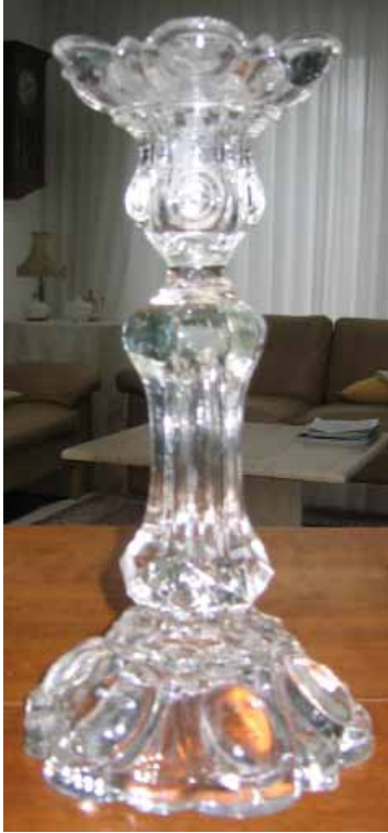
Abb. 2004-1/325 Leuchter Sammlung Valentin gemarkt mit „SV“, Hersteller unbekannt

Wir arbeiten uns weiter durch die Reihen, vorbei an Unterwäsche, einem Vogelkäfig, Elektroartikeln, Küchenzubehör und Sonstigem. Aus dem rechten Augenwinkel beobachte ich, wie eine Händlerin ein Salz-Pfefferglas auspackt und auf den Tisch stellt. Ich registriere: eckige Form, eher ungewöhnlich. Beim näheren Hinsehen im schummrigen Licht erschließt sich mir ein neogotisches Muster. Nicht schlecht! „Bonjour madame, quel est le prix?“ Ich strecke ihr das Glasteil entgegen. Sie hält beim Auspacken kurz inne, nennt einen Preis, 10 Euro. Ich untersuche das mir interessante, aber noch zu teure Stück genauestens. Leider hat es am Füßchen einen Chip, nichts von großer Bedeutung, aber ich weise darauf hin. „Il est abime un peu. 5 Euro, ca va aussi“, frage ich kurz. Dieses Mal hält sie beim Auspacken nicht inne, nickt nur kurz mit dem Kopf. „Oui“. Ich reiche ihr das Geld und packe vorsichtig die Pfeffer - Salz-Menage ein. Glück gehabt, ein Schnäppchen, gerade zur rechten Zeit am richtigen Platz gestanden. Solche Pressglasteile sind begehrt und meist teuer. Weiter rücke ich an Menschen vorbei, nehme aber nur gelegentlich Gesichter wahr. Meist ist der Blick nach unten gerichtet. Da, eine Tortenplatte „Saturn“ und ein Schälchen „Phönix“.