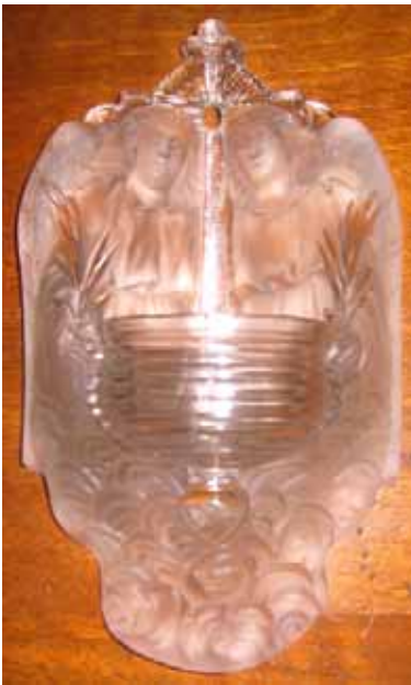
Abb. 2004-1/323 Weihwasserkessel Sammlung Valentin gemarkt mit „SV“, Hersteller unbekannt gleiches Glas auch von Vallérysthal s. MB Vallérysthal 1908, Folio 312, Nr. 4159

Es ist ein hin- und her Gerenne mit Kisten und Kästen, aufplatzende Plastiktüten werden hereingeschleift, verblichene Louis seize Stühle, deren gerupfte Sitzpolster die Füllwatte zum Vorschein kommen lassen, finden den Weg hierhin. Lampengestelle, mit heraushängenden, noch stoffummantelten Kabeln versuchen trotz fehlenden Glasschirme einen Käufer zu finden, der sie vielleicht wieder zum Leuchten bringen könnte. Autoreifen werden angerollt und kostbare Porzellanfiguren hereingetragen. Dazwischen wuseln die Suchenden, die teilweise aus den Kisten heraus ihr Fundstück kaufen oder mit Taschenlampe und Lupe das endlich passende Uhrwerk seelenruhig untersuchen. In das laute unbestimmte Gemurmel vieler Menschen mischen sich Zurufe. Gelegentlich ist ein Rumpeln und Quietschen zu hören, weil gar zu schwere Lasten kraftlos abgesetzt wurden oder ein großes Schrankteil geschoben werden musste. Das Klirren von Porzellan oder Glas lässt kurz aufhorchen, denn jetzt ist irgendetwas unwiederbringlich zu Bruch gegangen.