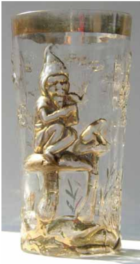
Abb. 2004-2/100 Becher mit Zwerg und Frosch auf Fliegenpilzen sitzend Waldlandschaft mit Laubbäumen und Gras farbloses, form-geblasenes Glas, 3 Formnähte Rand, Figuren, Wald und Gras golden bemalt goldene Aufschrift „Pöctjén“ (? kaum mehr lesbar) H 14,0 cm, D 7,1 cm Sammlung Geiselberger FG-026 Boden unten eingepreßt „GESETZLICH GESCHÜTZT“ unlesbare eingepreßte Marke (?) Hersteller unbekannt, Böhmen / Ungarn, um 1900

Der Vergoldung nach könnte der Becher wirklich aus dem böhmischen Raum stammen. Die auf der Unterseite des Bodens eingepreßte Aufschrift „GESETZLICH