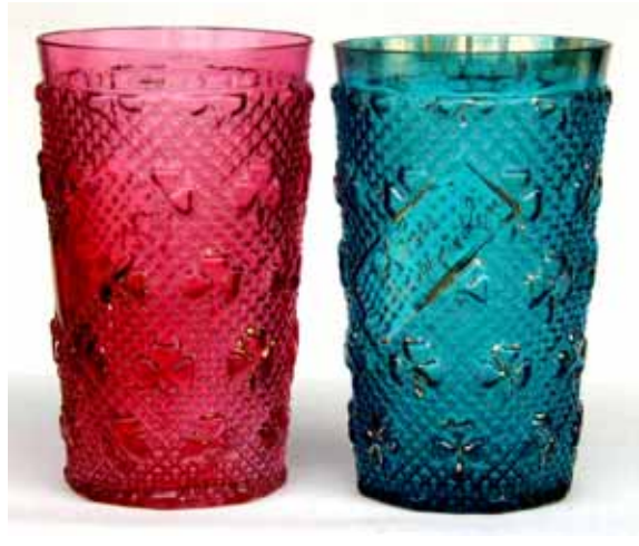
Abb. 2004-2/102 (Ausschnitt aus Abb. 2002-3-5/016) Musterbuch Rindskopf Nr. 12A, 1920/1927, Tafel Becher Nr. 2201, 2201 a., 2201 b