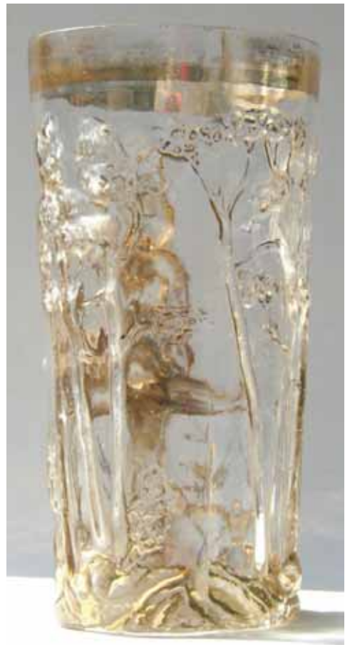
Abb. 2004-2/101 Becher mit Zwerg und Frosch auf Fliegenpilzen sitzend Waldlandschaft mit Laubbäumen und Gras

Wie bei den meisten dieser offenbar mit der Glasmacherpfeife - also mit der Lungenkraft des Glasmachers - in eine Form geblasenen Gläser ist die Wandung sehr dünn (rund 1 mm) und deshalb leicht zerbrechlich. Der