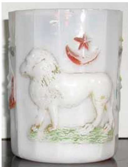
Abb. 2004-2/063 u. /064 Henkelbecher mit Löwe, Halbmond und Stern, zwei gekreuzte Fahnen, opak-weißes, kalt bemaltes Pressglas, H 13 cm, D 10 cm Sammlung Fehr, innen unten Marke „SV“ Hersteller unbekannt, Frankreich ?, um 1900 s. MB Bayel & Fains 1923, Tafel 43, Planche 13, BY 631