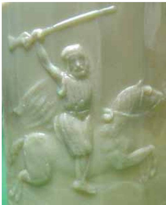
Abb. 2004-3/047 Henkelbecher mit arabischem Reitersoldaten, zwei Palmen der Reiter hat einen Bart, trägt eine Bluse und Pumphosen, einen Turban und einen wehenden Umhang, er schwingt eine Flinte mit langem Lauf beige-farbenes Pressglas, H 13 cm, D 10 cm Sammlung Christoph (siehe leichte Mamorierung) s. MB Bayel & Fains 1923, Tafel 43, Planche 13, BY 630

Die Henkelbecher „Spahis“ und „Lion“ für die arabisch-französischen Reitersoldaten könnten nach der Aufstellung der Truppen in den beiden letzten Jahrzehnten des