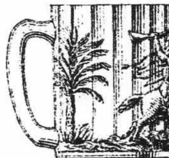
Planche 13, BY 630, Gobelets moulé Spahis, à anse