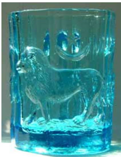
Abb. 2004-3/049 Henkelbecher mit Löwe, Halbmond und Stern, zwei gekreuzte Fahnen hellblaues Pressglas, H 13,4 cm, D 10,2 cm Sammlung Geiselberger PG-802, ehem. Lenek ohne Marke, Hersteller unbekannt, Frankreich ?, um 1900 vgl. MB Bayel & Fains 1923, Tafel 43, Planche 13, BY 631

der Zeichnung von Bayel Nr. 631. Er hat keine Marke und kommt sicher von Bayel. Der hellblaue Becher hat ebenfalls keine Marke, seine Fahnen entsprechen den beiden Henkelbechern Fehr mit Marke „SV“ völlig und weichen damit von der Zeichnung der Fahnen bei Bayel ab. Er könnte also sowohl von Bayel als auch vom Unternehmen „SV“ stammen. Seine Pressung weist darauf hin, dass er deutlich später als der kobalt-blaue Becher entstanden ist. Aber auch hier sind die 15 Seitenflächen unsauber gepresst, allerdings ohne Spannungsrisse. Übrigens zeigt auch der farblose Henkelbecher „Spahis“ viele kleine Spannungsrisse. Offenbar ging es bei den Gläsern für die arabischen Truppen nicht so „genau“. Denn andere Pressgläser von Bayel um 1900 zeigen durchaus die in Frankreich gewohnte Qualität. Die Löwen der 4 Gläser unterscheiden sich nicht von der Zeichnung und voneinander. Der arabische Reitersoldat mit zwei Palmen entspricht soweit auf der Zeichnung erkennbar völlig der Darstellung von Bayel.