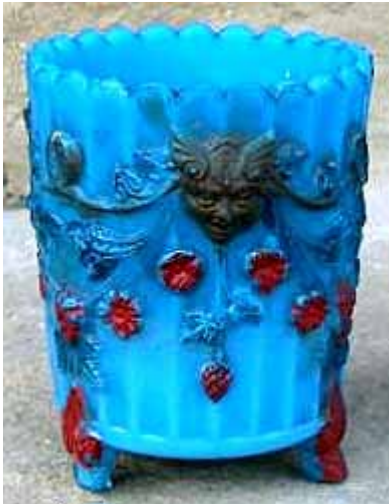
Abb. 2004-3/066 eBay Frankreich, Art.Nr. 2258992047, €96,50 "OPALINE VASE ET VERRE JOLI OPALINE BLEU. VASE H 9.5 cm, VERRE H 8 cm"