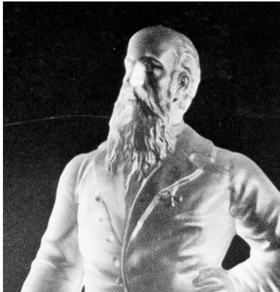
Abb. 2000-5/111 a Senfbecher mit Lilien (?), unregelmäßig gekörnter Grund Bildnis eines bärtigen Mannes in Uniformrock (?) wahrsch. Friedrich Ludwig Jahn (1778-1852) „Turnvater Jahn“ farbloses Pressglas, H 11,4 cm, D 6,4 cm Sammlung Geiselberger, PG-154 nicht gemarkt, Hersteller unbekannt, um 1900