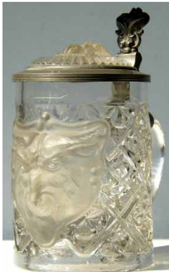
Abb. 2004-3/206 a, b Krug mit Bockskopf in Wappen-Schild, Rauten- / Kleeblatt-Muster als Grund, Zinn-Deckel m. Glas-Einsatz Bockskopf sehr schweres, farbloses Glas, Köpfe und Schild säuremattiert, H Rand 11,6 cm, D Rand 8,0 cm Sammlung Geiselberger PG-798 ohne Marke, vielleicht St. Louis, letztes Viertel 19. Jhdt. vgl. Franke 1990, Abb. 475, Nr. 1503 und MB St. Louis 1887, Planche 81 bis, Chope à anse, Nr. 1503

„Diamant“ kopiert. Beim Krug sind aber innerhalb der größeren Rauten 4-teilige Kleeblätter dargestellt, ebenfalls ein Pseudoschliff-Motiv.