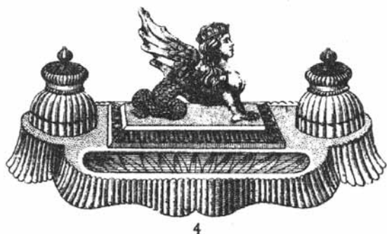
Abb. 2004-3/162 Catalogue Cristallerie Val Saint Lambert 1913, Tafel 48 ... Encriers, Nr. 4 „Chimère dépoli“, Cristal Maße der Basis des Schreibzeugs L 31 cm, B 15,5 cm Reprint Editions Collections Livres, Brüssel 1998