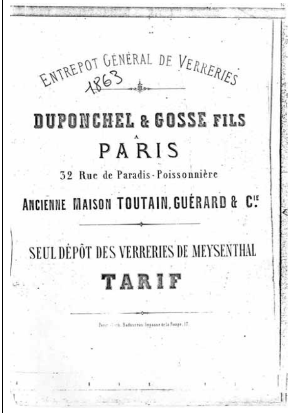
Abb. 2004-3/127 Musterbuch Meisenthal 1863 Titelblatt Duponchel & Gosse Fils Sammlung Musée du Verre et du Cristal Meisenthal

Entrepot Général de Verreries Duponchel & Gosse Fils à Paris 32 Rue de Paradis - Poissonnière Ancienne Maison Toutain, Guérard & Cie. Seul Dépôt des Verreries de Meysenthal Tarif Paris, Lith. Badoureau Impasse de la Pompe, 17 Die Jahreszahl 1863 ist handschriftlich auf dem Titelblatt vermerkt.