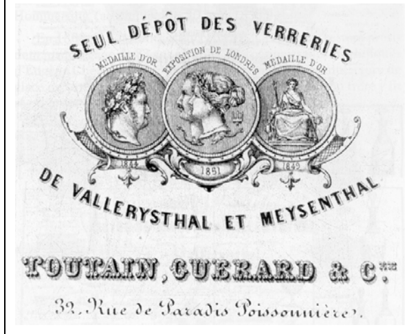
Abb. 1999-3/065 Ankündigung der gemeinsamen Glashandlung Toutain, Guérard & Cie. der Glashütten Vallérysthal und Meisenthal in Paris, 32 Rue de Paradis de Poissonnière um 1854 aus Stenger 1988, S. 136

Die handschriftliche Notiz der Jahreszahl 1863 auf dem Titelblatt passt mit den Angaben bei Stenger 1988, S. 136, zusammen und ist deshalb sehr wahrscheinlich richtig, auch wenn unklar ist, wann sie hinzugefügt wurde.