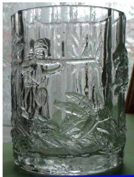
Abb. 2004-4/185 eBay Frankreich, Art.Nr. 2271546903, € 11,50 "CHOPE CHASSE LION ZOUAVE, H 13 cm, D 6 cm" SG: MB Vierzon 1889, 2 ème Partie 1891, No. 3090, Chope „Tartarin“