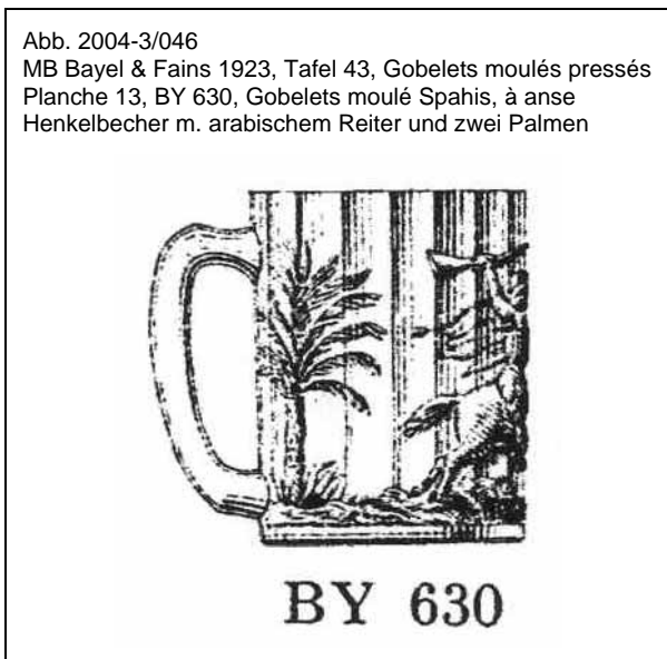
Abb. 2004-3/046 MB Bayel & Fains 1923, Tafel 43, Gobelets moulés pressés Planche 13, BY 630, Gobelets moulé Spahis, à anse Henkelbecher m. arabischem Reiter und zwei Palmen

Daudet schuf mit dem komisch-satirischen Roman "Les aventures prodigieuses de Tartarin de Tarascon" [Die wunderbaren Abenteuer ...] eine Persiflage des Franc-tireurwesens, und mit Tartarin de Tarascon den Romanhelden, der die kleinstädtischer Philister der Stadt Tarascon und in der Provence in ganz Frankreich zum Urbild südfranzösischer Kleinbürger machte.