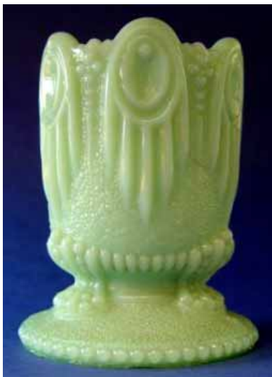
Abb. 2004-4/097 Porte-allumettes, opak-grünes Glas, H 7,5 cm Sammlung Christoph ohne Marke, gleich Abb. 2004-4/096, gemarkt „PORTIEUX“ s. MB Portieux 1914, Planche 6, Articles divers, No. 7197, Porte-allumettes „gothique“

Skrupel etwas zu kopieren (Form und Dekor), dann um wenigstens den Maßstab zu verändern. Dieses Modell ist abgebildet im Musterbuch der Cristallerie de Vierzon (Cher), les Fils d'Adrien Thouvenin, Articles du premier supplément au tarif de 1889, deuxième partie 1891, Planche 208, folio 108, No. 3317, mit der Bezeichnung „porte-cigare“.