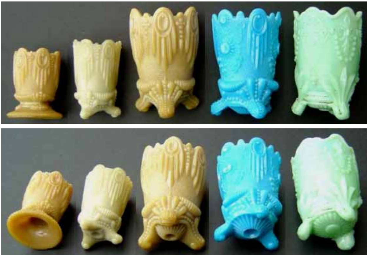
Abb. 2004-4/094 von links Porte-allumettes, opak-braun, H 7,5 cm, gemarkt „PORTIEUX“, Nr. 7197 // opak-beige, H 8,7 cm, gemarkt „SV“ Porte-cigares, opak-braun, H 11 cm, gemarkt „PORTIEUX“, Nr. 7346 // opak-blau, H 11 cm, gemarkt „SV“ opak-hellgrün, H 11,5 cm, ohne Marke, Vierzon, No. 3317, alle Sammlung Christoph