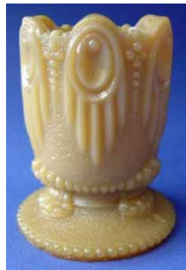
Abb. 2004-4/096 Porte-allumettes, opak-braunes Glas, H 7,5 cm Sammlung Christoph Unterseite am Rand gemarkt „PORTIEUX“ s. MB Portieux 1914, Planche 6, Articles divers, No. 7197, Porte-allumettes „gothique“

ebenso die Motive der „Ohrgehänge“ [pendeloques] (doppeltes Oval mit einem Punkt und mit 5 senkrechten Spitzen). Diese Motive sind bei allen vier vorgestellten Gläsern gleich. Ich konnte dieses Motiv auch bei einem Eierbecher „Poulet“ [Küken] feststellen, wie ihn Portieux, Vallérysthal, Bayel und andere produzierten. Aus durchscheinend weißem Glas, hat er keine Fabrikmarke. Sein Dekor ist verwandt mit einem Becher, wie ihn St. Louis und Baccarat zu gewissen Zeiten fertigten. Dieses letzte Modell „SV“ scheint ebenso in reduzierter Ausführung zu existieren, wahrscheinlich zum Gebrauch als Streichholzbehälter.