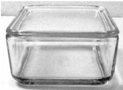
Abb. 2004-4/303 Vorratsdose, farbloses Pressglas auf Boden aufgepresst „PONCET“ „von Poncet“ Glashüttenwerke AG Friedrichshain, um 1935 Sammlung Stadtmuseum Cottbus, Inv.Nr. V 15653/B

Manske: „Die Poncet Glashüttenwerke haben bereits 1935 stapelbare Vorratskästen hergestellt; vorwiegend für den Handel entwickelt, wurden sie auch für Speisekammer und Kühlschrank angeboten. Wagenfelds „Kubus“-Geschirr ist schon konsequent für den Privathaushalt konzipiert. Aus den zwei Kästen des Poncet-Geschirrs werden sieben unterschiedliche Kästen und Krüge, die, dem Rauminhalt des Kühlschranks angepasst, gestapelt einen Kubus ergeben.“