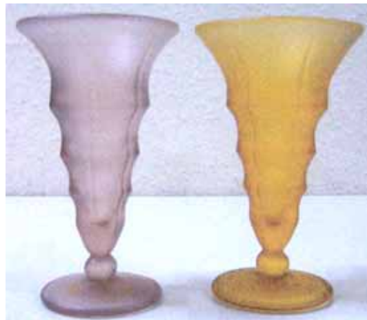
Abb. 2004-4/305 Fußvasen, farbiges, mattiertes Pressglas auf dem Boden aufgepresst „Satinglas“ und Werkzeuge Glasfabrik Paul & Stäglich GmbH., Dresden, 1931 Sammlung Stadtmuseum Cottbus, Inv.Nr. V 13484/B

taucht in unserer Sammlung nochmals auf bei 2 Fußvasen, ebenfalls aus mattiertem farbigem Glas, hier allerdings nicht als Papieraufkleber, sondern auf dem Boden aufgepresst.