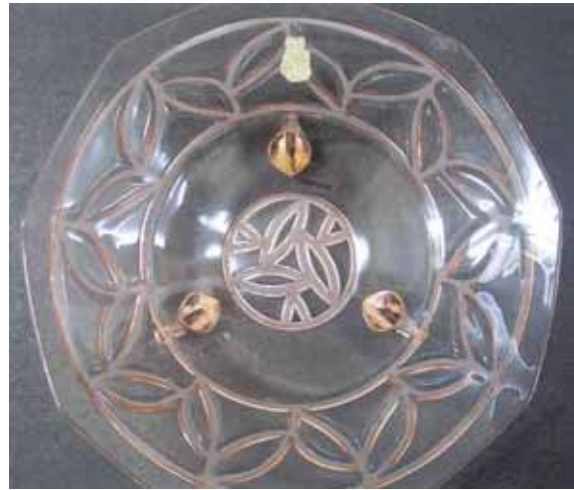
Abb. 2004-4/309 Schale „Maria“ Etikett „W“ und „Maria D.R.G.M.“ Glasfabrik Horst Walther, Schwepnitz Sammlung Stadtmuseum Cottbus, Inv.Nr. V 15346/B Marke „W“, Glasfabrik Horst Walther, Schwepnitz, 1937 aus Hartmann 1997, S. 866, Nr. 8372

In unserer Sammlung befindet sich eine Schale aus rosa Pressglas auf 3 gerollten Füßen mit einem nicht ganz vollständigem, jedoch leserlichen Papieraufkleber (siehe Foto / leider nicht so gut geworden): „W“ (Wappenform), darunter „Maria D.R.G.M.“, lt. Glasmarkenlexikon Hartmann 1997: Glasfabrik Horst Walther, Schwepnitz (gegr. 1932)