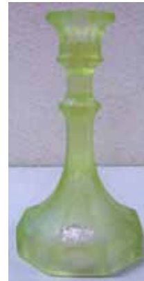
Abb. 2004-4/304 Leuchter, grünes, mattiertes Pressglas Etikett „Satinglas“ und Werkzeuge Glasfabrik Paul & Stäglich GmbH., Dresden, 1931 Sammlung Stadtmuseum Cottbus, Inv.Nr. V 13485/B Marke „Satinglas“ und Werkzeuge aus Hartmann 1997, S. 243, Nr. 5359

ten dazu. Diese Firma Paul & Stäglich GmbH wiederum taucht erneut auf in PK 2004-3, Anhang 08 (auf S. 2 oben rechts als Stempel) im Zusammenhang mit dem Musterbuch Radeberg 1928. Hartmann 1997: „Die Firma produziert und vertreibt Hohl- und Tafelglaswaren aller Art“