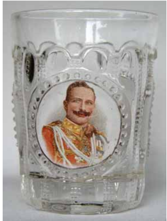
Abb. 2004-4/223 u. /224 Becher mit 3 Schildern, Kaiser Wilhelm II. Generalfeldmarschall Paul von Hindenburg farbloses Pressglas mit Chromolithografie-Abziehbild H 9,8 cm, D 7,5 cm Sammlung Geiselberger PG-832 vgl. Preis-Kurant Pressglas Inwald 1914, Becher Nr. 6383

Da Kaiser Franz Joseph I. 1916 gestorben ist und Paul von Hindenburg durch die gewonnene Schlacht von Tannenberg 1914 berühmt wurde, müssen die beiden Becher zwischen Ende 1914 und 1916 entstanden sein. Die Grundform findet man im Preis-Kurant Pressglas Inwald 1914 unter den Bechern als Nr. 6383, „Walzenbrillant mit 3 Schildern“. Diesen Becher gab es mit eingepressten Motiven von Wallfahrtskirchen und mit verschiedenen gemalten Bildchen. Wahrscheinlich wurde der Becher auch ohne runde Schilder und mit wagrechten, schmalen, 8-eckigen Schildern hergestellt. Davon habe ich aber noch kein Beispiel gefunden.