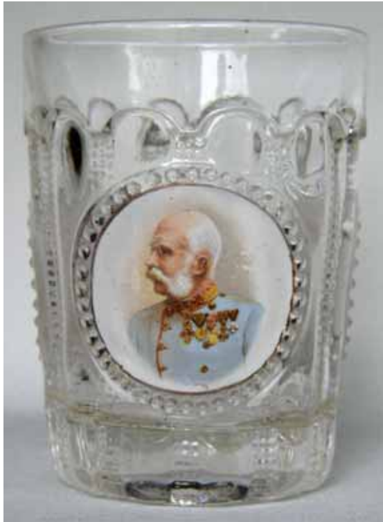
Abb. 2004-4/222 Becher mit 3 Schildern, Kaiser Franz Joseph I. farbloses Pressglas mit Chromolithografie-Abziehbild H 9,8 cm, D 7,5 cm Sammlung Geiselberger PG-832 vgl. Preis-Kurant Pressglas Inwald 1914, Becher Nr. 6383

Die Chromolithografie-Bilder unterscheiden sich aber in Details und die runden Rahmen mit den Perlen um die Bilder unterscheiden sich auch. Bei den Bildern des Bechers Stopfer sind die Kriegsherren von Lorbeer- und Eichenzweigen umgeben und ein Bändchen weist jeweils auf den Abgebildeten hin.