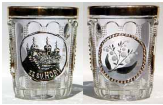
Abb. 2002-4/013 Becher mit Blüten von Maiglöckchen und Bild einer Klosterkirche „ZE SV. HORY“ farbloses Pressglas, teilw. vergoldet u. bunt bemalt Sammlung Geiselberger PG-067, H 9,7 cm vgl. Preis-Kurant Pressglas Inwald 1914, Nr. 6383

Adlerová 1972, Kat.Nr. 118 Becher für Wasser, zylindrisch, unten verengt, drei kreisförmige Medaillons, zwei m. Schwalben u. ... Brief (Emailmalerei), Glas vollständig kanneliert u. Reihen von Perlen, um das vergoldete Medaillon Perlen, H 10 cm SM Liberec, S 2.929 Böhmen oder Mähren, um 1900