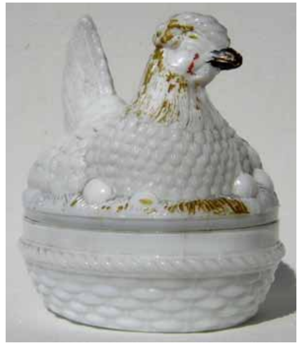
Website Shirley Smith, http://www.gransplace.com/hens.htm ... Maker Unknown, No. 21:

„German“ Hen on Nest, Size: 6.32” x 4.4” [L 16,3 cm, B 11,4 cm] This is probably the same hen pictured and commented on in Opaque News, December 1989, 520. See Arnold Becker’s German Website at http://www.pressglas.de/Sammlung/Dosen_einfu/D/Dosen_6/dosen_6.html ; Figure 73 German? hen; Figure 74 Catalog picture of a company in Poland, 1896? Same as Figure 60?