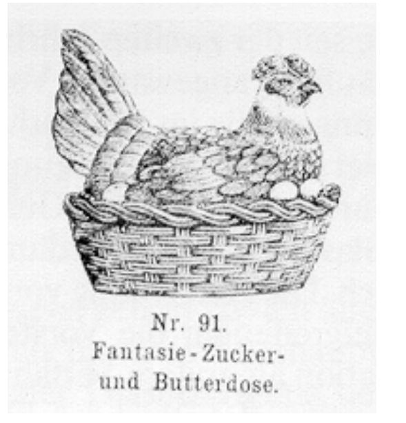
Abb. 2000-4/001 Deckeldose Henne im Korb opak-weißes Glas mit bunter Kaltbemalung, H 12 cm, L 19 cm, B 14,6 cm aus Chiarenza 1998, S. 56, Abb. 107, 2. Version innen im Deckel Marke SV, eine von 3 ähnlichen Dosen mit Zusatz „Marseille“, France Hersteller unbekannt, Frankreich, um 1900 ? vgl. a. Abb. 2000-4/045, Musterbuch Allmann 1906