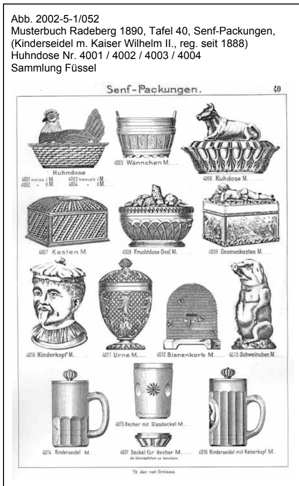
Abb. 2002-5-1/052 Musterbuch Radeberg 1890, Tafel 40, Senf-Packungen, (Kinderseidel m. Kaiser Wilhelm II., reg. seit 1888) Huhndose Nr. 4001 / 4002 / 4003 / 4004

Die Henne auf Korb von S. Reich & Co. um 1975 war ein Grundtyp, der oft kopiert wurde. Dabei wurden aber die Küken durch Eier ersetzt. Auch diese Szene ist sehr lebensecht, mit Küken steckt aber mehr „Leben“ im Pressglas. Später wurde das Gefieder der Hennen schematisch, vereinfacht dargestellt. (z.B. Abb. 2000-4/001)