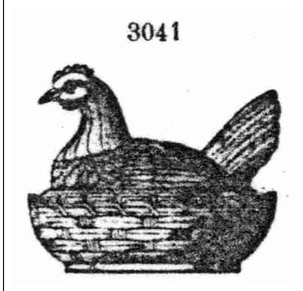
Abb. 2003-2-02/015 (Ausschnitt) Preis-Courant S. Reich & Co. Mai 1873, Tafel 28 Nr. 3041, Deckeldose Henne auf Korb

Die Henne und der Korb sind sehr realistisch erfunden. Bei der Henne sind fünf Küken, vier unter ihren Federn und eines auf dem Rücken. Insgesamt stellt die Deckeldose eine sehr lebensgetreue Szene dar, die zur allgemeinen Beliebtheit von lebenden Glucken mit Küken schon immer beigetragen hat. Da ich selber seit langem Hühner halte, die frei herumlaufen dürfen und immer wieder für Küken sorgen, kann ich bestätigen: genau so sieht es aus, wenn die Küken unter die Flügel der Glucke schlüpfen und einige Küken frech unter den Federn heraus schauen, während das mutigste Küken auf dem Rücken der Glucke sitzt. Die Glucke hat den Kropf voll Körnern.