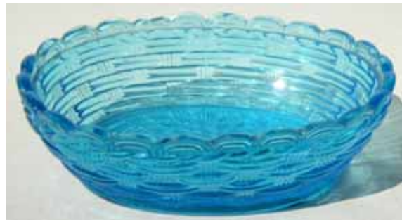
Abb. 2004-4/003 / 004 /005 Deckeldose Henne mit fünf Küken auf einem Korb, Henne farbloses, matt. Pressglas, H 9,4 cm, B 11,1 cm, L 13,1 cm Korb blaues Pressglas, H 4,6 cm, B 12,3 cm, L 15,4 cm, H insg. 13,2 cm, Sammlung Chiarenza, ohne Marke s. Preis-Courant S. Reich & Co. Mai 1873, Tafel 28, Zuckerdosen u. Zuckerkoffer, Nr. 1979 (Abb. 2003-2-02/015)

Der Korb misst Höhe 4,6 cm (1 7/8 inches), Breite 12,3 cm (4 7/8 "), Länge 15,4 cm (6 1/8 ") die Henne misst Höhe 9,4 cm (3 3/4 inches), Breite 11,1 cm (4 3/8 "), Länge 13,1 cm (5 1/4 ") Höhe insg. 13,2 cm.