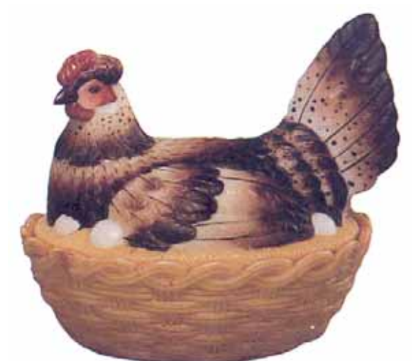
Abb. 2000-4/047 (hier ohne Bild) Deckeldose Henne im Korb aus MB Gebr. Allmann, München 1906, Blatt 5, Henne 251 Schnabel und Rand gemalt -40 Pf. ganz gemalt -50 Pf. blau und grün gemalt -30 Pf. Korb m. 3 senkrechten u. 2 wagrechten Stäben

S.a. PK 1999-3, Der Waren-Katalog Allmann von 1906, S. 1 u. 8: „Im Musterbuch Gebrüder Allmann 1906 sind auf der selben Seite mehrere Deckeldosen abgebildet [8], die auch im Musterbuch Vallérysthal & Portieux