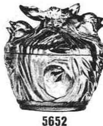
Abb. 2004-4/026 Deckeldose als Vögel in einem Taschentuch Rückseite m. Stempel (vgl. Stempel Abb. 2004-4/027) Zeichnung für Verreries de Vallérysthal, Nr. 3661 Maschinen- und Formenfabrik F. W. Kutzscher GmbH, Dresden-Deuben, um 1890? Sammlung Christoph