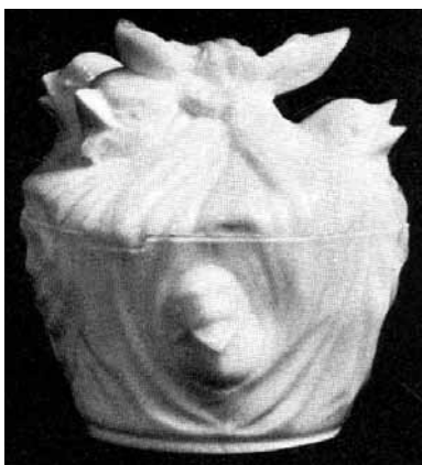
Abb. 2004-4/038 Deckeldose als Vögel in einem Taschentuch aus Ferson, Yesterdays Milk Glass Today, S. 27, Abb. 97

„Ein sehr ungewöhnliches und gleicherweise geheimnisvolles Stück ist dieses entzückende Glas. Der gut entworfene Behälter stellt eine Deckelschale dar, die als Taschentuch geformt ist, dessen vier Ecken oben zusammengeknotet sind, um einen Knauf zu bilden. Die Köpfe von Vögeln schauen aus den Öffnungen heraus. Der Deckel hat zwei flanschen-artige Zapfen, die in Öffnungen des Bodens passen und ein Rotieren des Deckels verhindern. Das ganze Glas deutet stark auf eine Herkunft aus Frankreich hin. Durchmesser 4 Zoll [= ca. 10 cm]. Selten.“ [Übersetzung SG]