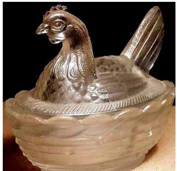
Figure #9 a Vallerysthal 3-inch, clear, divided [SG: siehe Mail von Shirley Smith links: sie ist jetzt sicher, dass es sich bei dieser Dose um eine Henne von S. Reich & Co. handelt! Die Henne gleicht auch der Henne Abb. 2004-4/022 in allen Details, die man auf dem Foto erkennen kann, der Korb ist allerdings wie der der Henne PG-843! Man könnte sich die Haare ausreißen!]