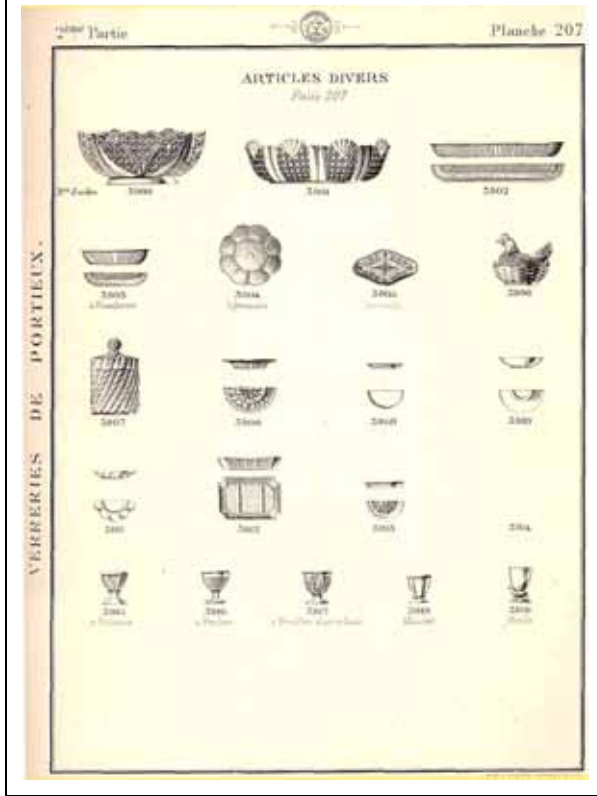
Abb. 2001-05/530 Musterbuch Portieux 1894, Pl. 207, Articles diverses Sammlung Triboulot