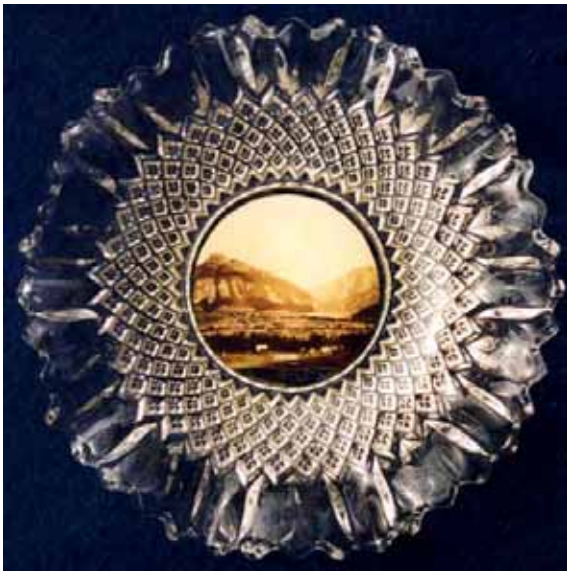
Abb. 2004-4/147 Ovale Schale mit eingeklebter Fotografie von Glauchau, farbloses Glas, L xxx cm, B xxx cm Sammlung Vogt, eingepresste Marke „Rd254027“ Davidson, Dekor „Somerset“