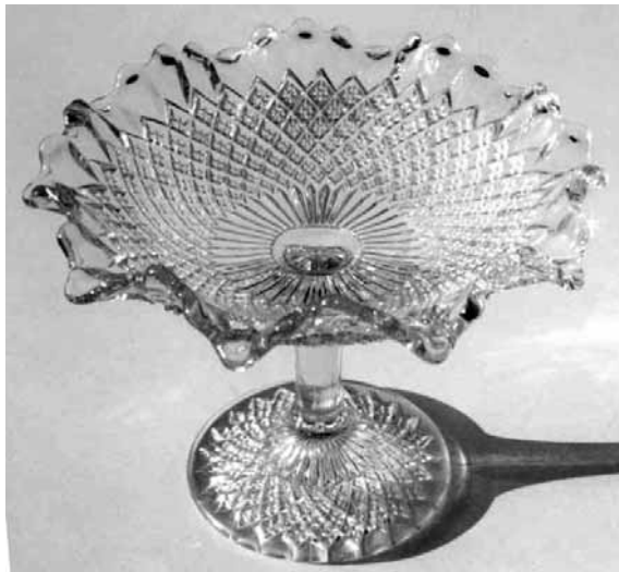
Abb. 2005-1/206 a/b Fußschale mit Minirauten, facettierter Rand gefaltet Fuß angesetzt, gestuft, mit Minirautenmuster farbloses Pressglas, H 16 cm, D 21 cm, 4 Formnähte Sammlung Billek gemarkt „Rd 254027“, George Davidson & Co., Teams Glass Works, Gateshead-on-Tyne, 1. Mai 1895