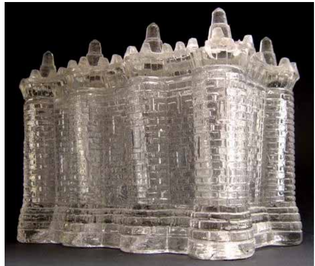
Abb. 2005-1/145 a/b Deckeldose Bastille, Inschrift „LA BASTILLE 1789“, Vorderseite und Rückseite, farbloses Glas, H 12 cm, L 15,5 cm, B 10 cm Sammlung Christoph, s. MB Bayel / Fains 1923, Planche 40, Bayel Nr. 1831