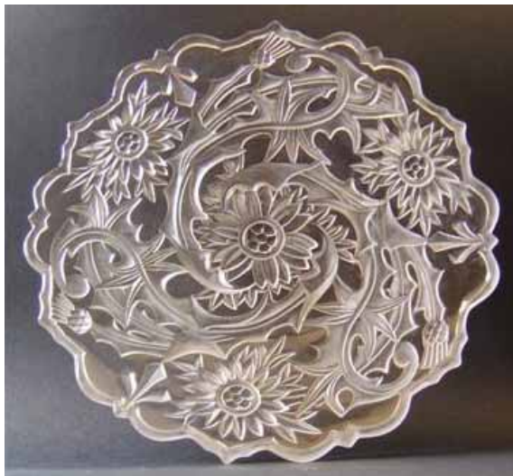
Abb. 2005-1/200 a/b Teller mit Distel-Dekor farbloses Pressglas, partiell mattiert, D 25,7 cm Sammlung Christoph innen gemarkt „VALLÉRYSTHAL“ s. MB Vallérysthal 1907, Planche 226, Assiettes rebrûlées, Nr. 3615

hier ein paar Photos von einem Teller und einer Fußschale aus Vallérysthal. Sie sind vergleichbar mit Corbeille / Compottschaale Nr. 4246 (Dm 240 mm / 190) im Katalog Vallérysthal 1902, Nachtrag II., Planche 2. Vielleicht interessiert Sie das für den Artikel über den Katalog Vallérysthal 1902.