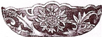
Abb. 2005-1-04/030 (Ausschnitt) MB Vallérysthal 1907, Planche 231, Folio 227 - 229, Corbeilles, Nr. 3696, „chardons dépolies“ vgl. Abb. 2005-1-07/011 MB MB Vallérysthal 1902, Nachtrag II., Planche 2, Compotschaalen, Corbeilles, Nr. 4246 (Dm 240 mm / 190 mm)