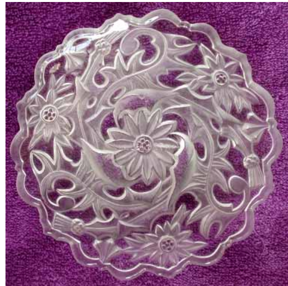
Abb. 2005-1/202 Teller mit Distel-Dekor farbloses Pressglas, partiell mattiert, D xxx cm Sammlung Nannie van Dam innen gemarkt „VALLERYSTHAL“ s. MB Vallérysthal 1907, Planche 226, Assiettes r., Nr. 3615

Der „Chardon“ wurde oft verwendet als Symbol gegen die Annexion von Elsaß - Lothringen durch das Deutsche Reich nach 1870 und während des 2. Weltkriegs. Der „Chardon“ wurde selbstverständlich auch oft in der französischen Kunst um 1900 benutzt, z.B. eine Skulptur vor dem „Musée du fer“ in Jarville, in der Umgebung von Nancy. Es ist auch selbstverständlich, dass man bei den Disteln auf den Titelblättern der Musterbücher von Portieux 1914 und 1933 an diese Symbolik denken muss und auch bei Gläsern mit dem gepressten oder gravierten Motiv „Chardon“, wie z.B. Teller und Fußschale, Sammlung Christoph. Auch die Gläser in MB Portieux 1933, vase moulé „chardon“, Nr. 1505 und Nr. 7864, gehören in diesen Zusammenhang. (siehe auch nächste Seite!)