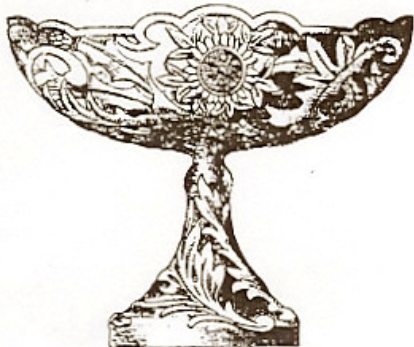
Abb. 2005-1-04/019 (Ausschnitt) MB Vallérysthal 1907, Planche 219, Folio 219, Coupes à dessert à pied élevé, Nr. 3507, Chardons