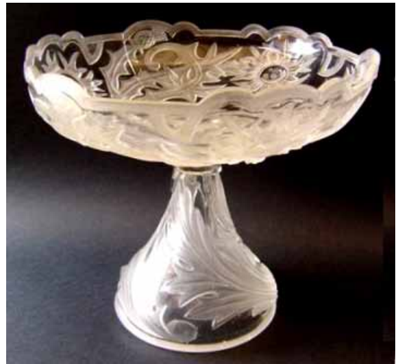
Abb. 2005-1/201 a/b Fußschale mit Distel-Dekor farbloses Pressglas, partiell mattiert, H 21 cm, D 25 cm Sammlung Christoph nicht gemarkt s. MB Vallérysthal 1907, Planche 219, Coupes, Nr. 3507