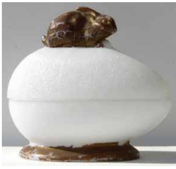
Abb. 2005-1/649 Deckeldose als Hase auf einem Ei opak-weißes Glas, goldene Kaltbemalung H 11 cm, L 12 cm, Sammlung Geiselberger PG-620 vgl. Sammlung Fehr, s. Abb. 2004-1/365 u. 2004-1/366 innen gemarkt „VALLERYSTHAL“, Vallérysthal, um 1900