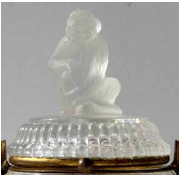
Abb. 2005-1/103 (Ausschnitt) MB Baccarat, um 1880?, 2° Partie, Pl. 271, Articles divers Nr. 4898, ovale Dose „Müder Löwe“ Nr. 4899, runde Dose „Liegender Hund“ Nr. 4900, runde Dose „Schnäbelnde Tauben“ Nr. 4902, „Adler?“ als Presse-Papier Nr. 4903, „Sitzender Affe“ als Presse-Papier Nr. 4904, „Schnäbelnde Tauben“ als Presse-Papier Sammlung Fehr