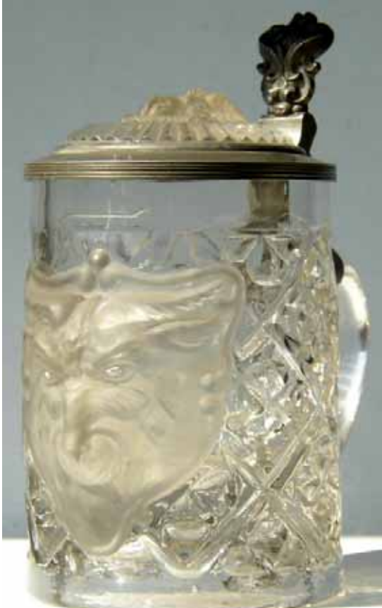
Abb. 2004-3/206 a, c Krug mit Bockskopf in Wappen-Schild, Rauten- / Kleeblatt-Muster als Grund, Zinn-Deckel m. Glas-Einsatz Bockskopf sehr schweres, farbloses Glas, Köpfe und Schild säure-mattiert, H Rand 11,6 cm, D Rand 8,0 cm Sammlung Geiselberger PG-798 ohne Marke, vielleicht St. Louis, letztes Viertel 19. Jhdt. vgl. Franke 1990, Abb. 475, Nr. 1503 und MB St. Louis 1887, Planche 81 bis, Choqe à anse, Nr. 1503