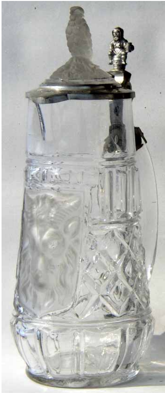
Abb. 2005-1/303 a/b

Abb. 2005-1/302 (s.a. Abb. 2000-6/118 u. Abb. 2004-3/205) Krug mit Bockskopf in Wappen-Schild, Rauten-Muster als Grund, Zinndeckel mit Vogel aus Pressglas, sehr schweres, farbloses „weißes“, Glas, H Rand 25 cm, D Rand 9 cm Sammlung Geiselberger PG-578 (2) s. MB St. Louis 1887, Planche 81, Nr. 1504