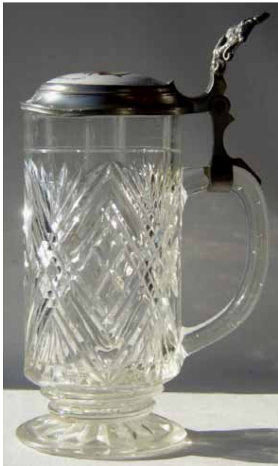
Abb. 2005-1/304 Bierkrug mit Pseudo-Schliffdekor und Zinndeckel Porzellan-Einlage mit Inschrift und Bild "Hoch lebe das edle Handwerk der Schreiner!" Hobel, Säge, Zirkel, Meißel, Meterstab, Bohrer im Boden außen eingepresste Marke „SG in Krone“ Sächsische Glasfabrik Radeberg, um 1900 s. MB SG Radeberg 1928, Tafel 29, Bierseidel, „Kaiser“

Das Muster des Bierkrugs kam mir bekannt vor, ich schaute aber vor dem Kauf nicht nach. Der Bierkrug hat eine im Boden außen eingepresste Marke „SG in Krone“. Auf dem Foto ist sie deshalb spiegelverkehrt: sie sollte von innen beim Trinken erkennbar sein. Ein früher Versuch der Sächsischen Glasfabrik Radeberg, um 1900 Kunden-Bindung herzustellen. Man könnte an den finnischen Spruch denken: „Wir trinken bis Iittala erschient!“