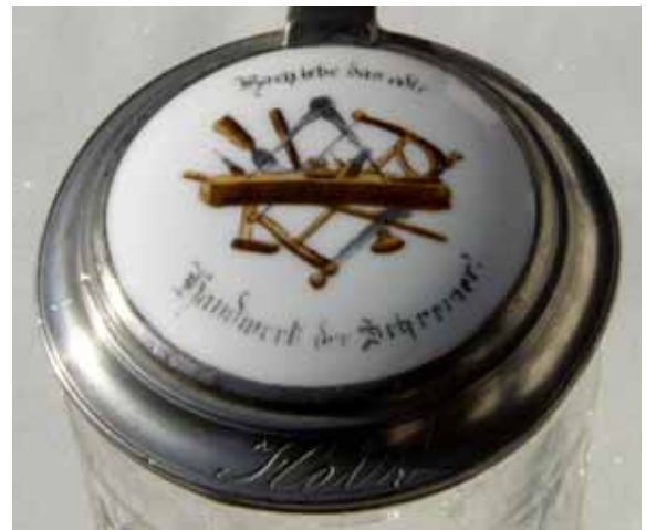
Abb. 2005-1/305 a/b Bierkrug mit Pseudo-Schliffdekor und Zinndeckel Porzellan-Einlage mit Inschrift und Bild "Hoch lebe das edle Handwerk der Schreiner!" Hobel, Säge, Zirkel, Meißel, Meterstab, Bohrer im Boden außen eingepresste Marke „SG in Krone“ Sächsische Glasfabrik Radeberg, um 1900 s. MB SG Radeberg 1928, Tafel 29, Bierseidel, „Kaiser“

Das Muster des Bierkrugs kam mir bekannt vor, ich schaute aber vor dem Kauf nicht nach. Der Bierkrug hat eine im Boden außen eingepresste Marke „SG in Krone“. Auf dem Foto ist sie deshalb spiegelverkehrt: sie sollte von innen beim Trinken erkennbar sein. Ein früher Versuch der Sächsischen Glasfabrik Radeberg, um 1900 Kunden-Bindung herzustellen. Man könnte an den finnischen Spruch denken: „Wir trinken bis Iittala erschient!“