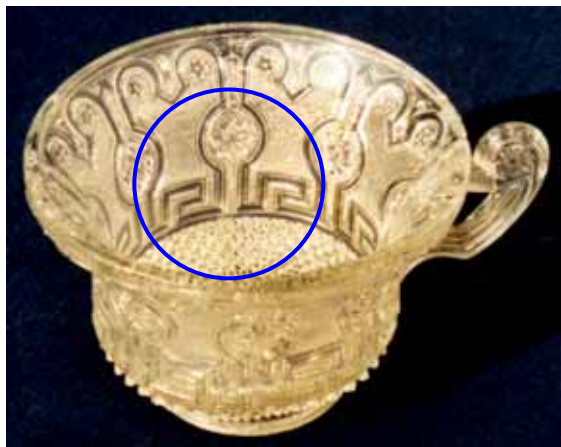
Abb. 2005-1/081 a/b Tasse und Untertasse mit Sternen, Bändern und Sablée farbl. Glas, Tasse H 8,8 cm, D 12,3 cm, Teller D 18,4 cm Sammlung Stopfer St. Louis (oder Zoude, Namur?), um 1840 s. MB Launay, Hautin & Cie. 1840, Planche 31, Nr. 1476 S t .L. (St. Louis), „Tasse à déjeuner m. sablée gothique“

Zur „Tasse à déjeuner m. sablé gothique“ möchte ich folgendes bemerken: