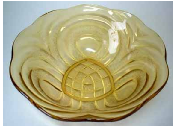
Abb. 2005-1/333 a/b eBay England, Art.Nr. 3780784475, € 14,50 "Art Deco amber glass bowl/dish ... August Walther & Söhne in the 1930's ... 'Rotterdam Pattern' ... featured in their 1935 product catalogue (see picture below)", H 7,5 cm, D 22,5 cm