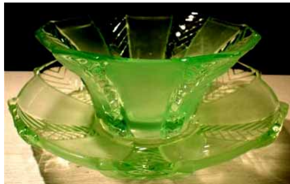
Abb. 2005-1/335 a/b eBay England, Art.Nr. 3779197451, €27,70 "Art Deco green glass dish & plate set ... Vaseline/Uranium green glass ... Produced by August Walther & Söhne in the 1930's, ... 'Athene Pattern' ... featured in their 1934 product catalogue (see picture below) ...", Schale H 5 cm, D 12 cm, Teller D 15 cm

sieht man bei der Vase „Athene“ (siehe unten): bei „Athene“ original / alt waren Fischgrät-Muster und Füße matt und nicht wie hier umgekehrt! (MB Walther 1934, Tafel 14, „Service clear and with matted etched borders / .. mit matten geätzten Bändern ... Lieferbar in den Farben weiß, azurblau, rosé, [uran-]grün, rauchtopas, bernstein“) Die in eBay angebotene Schale „Athene“ ist also nicht von Walther 1934, sondern von VEB Sachsglas 1948-1965!