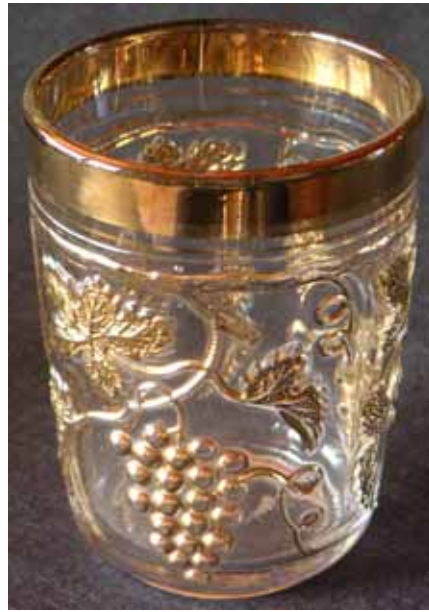
Abb. 2005-2/xxx Becher, gepresst, Baccarat oder St. Louis, um 1840 Sammlung Eickmann