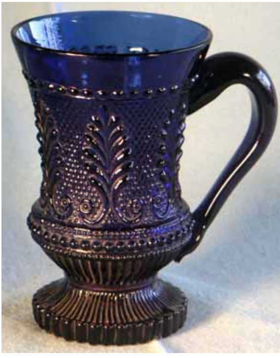
Abb. 2005-2/xxx Ausstellung „Gläser sammeln - eine Leidenschaft“ Henkelbecher, form-geblasen, wohl Steiermark, um 1850 Sammlung Eickmann

Handwerk und Handel ließen die Einhardstadt im Mittelalter erblühen, es entstand eine liebenswerte historische Altstadt, deren zahlreiche, umsichtig restaurierte Fachwerkhäuser ihr ein besonderes Gepräge geben. Die Benediktinerabtei Seligenstadt präsentiert sich heute als überwiegend barocke Klosteranlage der Zeit um 1700. In dem 1685 errichteten Konventbau, in dem das Landschaftsmuseum untergebracht ist, befanden sich bis 1803 die Gemeinschaftsräume der Benediktiner. Im Erdgeschoss werden Wechselausstellungen gezeigt. Außerdem sind hier regionaltypische traditionelle Handarbeiten zu sehen: Perlenhäkeleien auf Taschen und Kleidern. [...]