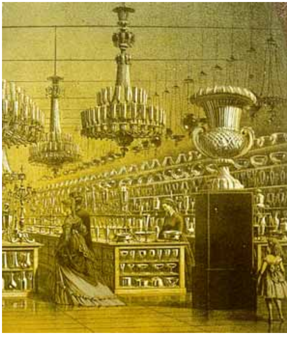
Abb. 1999-1/001 Verkaufs-Magazin und Lager [„magasin de vente et dépôt“] der Compagnie des Cristalleries de Baccarat, Paris, 30, Rue Paradis-Poissonnière, Archiv Baccarat, Stich um 1860 SG: ehemals Laden von Launay, Hautin & Cie. bis 1855 [Mucha 1979; Mucha 1982: bis 1851/1852; Vincendeau 1998: bis 1857], Trennung von St. Louis und Teilung des Gebäudes Rue Paradis-Poissonnière, No. 30 rechts im Vordergrund eine „Vase Medicis“, Hals „forme bambous“, Boden „forme diamants biseaux“, Sockel „forme bambous torsés“ aus Vincendeau 1998, S. 171 (Ausschnitt)

Man hat sich daran gewöhnt, als „Opaline“ alles opakes Glas oder Kristall [verre ou cristal opacifié] zu betrachten, wie auch immer seine Farbe und seine Herkunft ist. Wir knüpfen damit wieder an die Bezeichnungen an, die man in Venedig benutzte: „lattimo“, vom Italienischen Milch. Die Deutschen nannten es „Milchglas“ von Milch; die Franzosen nannten es „verre de lait“, bekannt seit dem XVII. Jahrhundert und schon vorher.