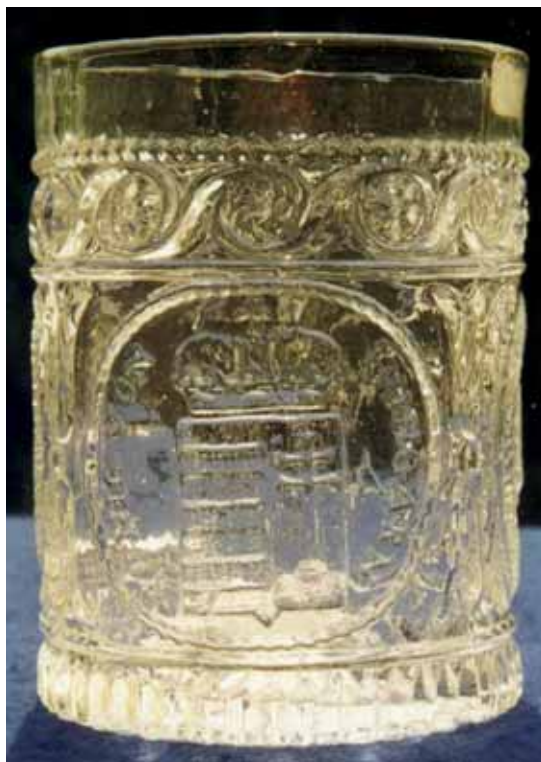
Abb. 2002-5/089 Becher m. Bildnis Kaiser Ferdinand I. v. Österreich-Ungarn, farbloses Glas, H 10,5 cm, D 7,7 cm linkes Medaillon: Doppeladler darunter „B“ und „V“ (Benedikt Vivat)