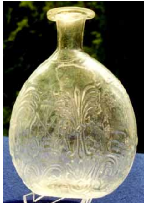
Abb. 2002-5/096 Flache Flasche „Tschuttera“ farbloses Glas, H 21 cm, B 15,5 cm in 3-teilige Form geblasen, angesetzter Hals fünf verschiedene umlaufende Ornament-Borten gemarkt „B.V.“ Sammlung Stopfer Benedikt Vivat, Langerswald b. Marburg, um 1840/1850

Abb. 2002-5/095 Flache Flasche „Tschuttera“ mit Büste Erzherzog Johann von Österreich (1782-1859, Steiermark 1815-1859) farbloses Glas, H 15,5 cm, B 11 cm in 4-teilige Form geblasen, angesetzter Hals vier abgebundene Palmetten Pflug mit Rechen, Sense, Dreschflegel mit Inschrift „1840“ Emblem aus Gabeln, Spaten, Säge und Messer Inschrift „GLASFAB. D. B.V. K.K. PRIV.“ Wappenschild mit Krone und Panther „STEYERMARK“ Sammlung Stopfer Benedikt Vivat, Langerswald b. Marburg, 1840 vgl. Eibiswald 1978, Abb. 94, PK Abb. 2000-5/055