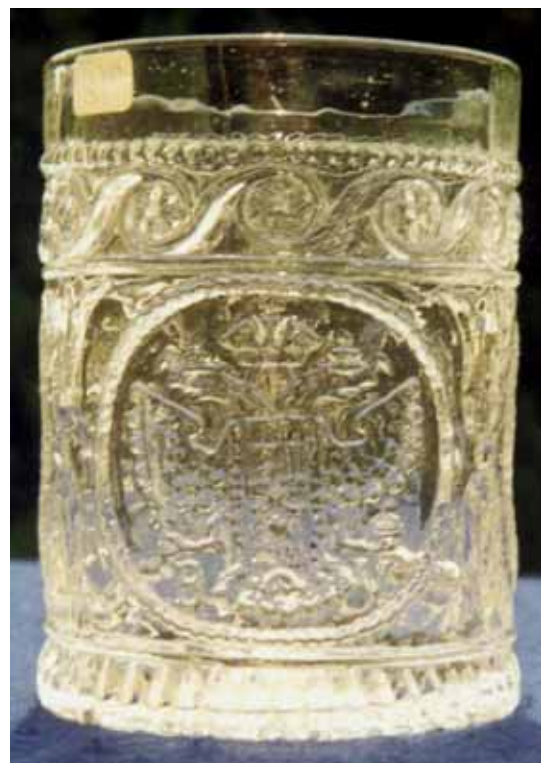
Abb. 2002-5/089 Becher m. Bildnis Kaiser Ferdinand I. v. Österreich-Ungarn, farbloses Glas, H 10,5 cm, D 7,7 cm linkes Medaillon: Doppeladler darunter „B“ und „V“ (Benedikt Vivat)