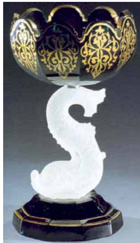
Abb. 2003-4/068 (vgl. Abb. 2002-4/038) Jardiniere mit Fuß als Delphin [Žardiniera] „Grünes Milchglas, geschliffen, Goldmalerei, Standfuß (Delphin) aus farblosem mattiertem Preßglas“, H 22,3 cm Adolfov u Vimperka [Adolf b. Winterberg] zugeschrieben, Meyrs Neffe V. Kralik, 1860-er Jahre Sammlung Jihočeské muzeum Budějovice (JMB) aus Dimt 1994, Ausst.-Katalog „Glas aus dem Böhmerwald“, Schlossmuseum Linz 1994, S. 246 f., Kat.Nr. 69 s.a. Panenková 1993, Kat.Nr. 149 (selbes Glas) vgl. Adlerová 1972, Kat.Nr. 28, Abb.Nr. 8

Um 1840 scheiterten alle Versuche im Raum Deutschland - Österreich - Böhmen - Ungarn (Kroatien) Pressglas aus Frankreich nachzumachen, dabei ging es nicht um Portraits sondern um Teller und Becher, vielleicht noch Kerzenleuchter!