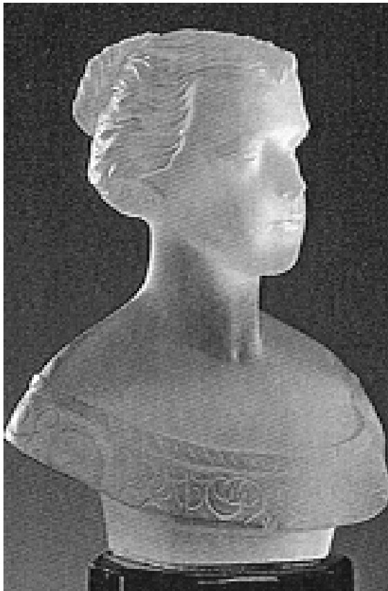
Abb. 2000-5/121 (Ausschnitt) Statuette mit Bildnis Kaiserin Elisabeth von Österreich farbloses Glas, H 19,9 cm, Sockel aus schwarzem Glas "Harrach'sche Glashütte, Nový Svět, 1855" Sammlung Kunstgewerbemuseum Praha aus Adlerová 1995, S. 7