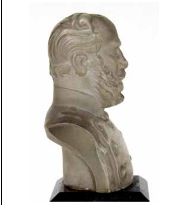
Abb. 2000-5/120 (Ausschnitt) Statuette m. Bildnis Kaiser Franz Joseph I. von Österreich aus Adlerová 1995, S. 7 farbloses Glas, H 20,3 cm, Sockel aus schwarzem Glas Harrach'sche Glashütte, Nový Svět, 1855 Sammlung Kunstgewerbemuseum Praha

Abb. 2003-3/001 Portraitbüste Kaiser Franz Joseph I. von Österreich-Ungarn farbloses Pressglas, mattiert, Büste H 6,6 cm, quaderförmiger Sockel aus schwarzem, geschliffenem und poliertem Glas, H 6,6 cm Sammlung Geiselberger PG-705 (ehem. Sammlung Wenske, Halberstadt) wohl Josef Riedel, Polubný [Polaun], um 1880 s. Riedel 1994, S. 132 f., Abb. 247, Abb. 248, Abb. 249, Abb. 251 u. Riedel 1991, S. 88 f.