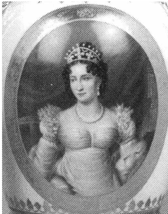
Porzellan, Wandung mit breitem goldenen Innenrand, außen goldene und weiße Ränder, Hals mit breiter Goldbördüre, Sternen, Lorbeerkränzen und Palmetten, Ansätze mit feinen Blattfriesen, im Goldrahmen der Medaillons matt-

goldene Rosetten und Blättchenbördüren, goldene Henkel mit Blattenden und goldgehöhten Blattmotiven, darunter zwei verschlungene Lorbeerkränze, rückseitig je zwei gekreuzte Füllhörner mit Lorbeerzweigen, Sternen und Strahlenkranz, seitlich goldene Efeuranken, goldener Fuß mit mattgoldenen Blattbördüren und goldener quadratischer Plinthe, H 33,5 cm