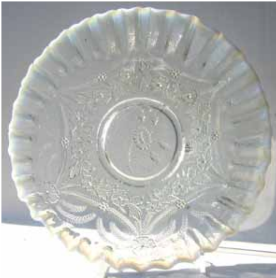
Abb. 2003-3/089 u. Abb. 2003-3/090 Teller mit Blüten, Blättern und Feder-Girlanden Rand gekniffen, Boden mit Blumen- und Rosen-Motiv farbl. Pressglas, Rand m. Anlauffarbe, H 3,5 cm, D 22,5 cm Sammlung Geiselberger PG-616, ehem. Sammlung Lenek Hersteller unbekannt, Deutschland (?), um 1930 (?)

Der farblose Teller mit opak-weißer Anlauffarbe am Rand stammt aus der Sammlung Lenek. Die Blüten und Blätter sind mit Punkten gefüllt, ein Detail, das oft vorkommt, aber nicht in der Kombination mit feinen Feder-Girlanden (oder Palmblättern) und dem im Bodenring eingepressten Blumenstrauß mit einer Ringelblume (?) und mit Rosenknospen.