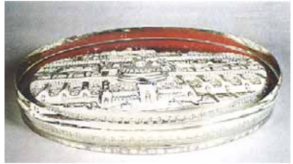
Abb. 2001-4/043 Paperweight „Rotunde“ zur Wiener Weltausstellung 1873 rechteckiges, farbloses Glas, Relief von hinten vergoldet H 2,2 cm, L 11,2 cm, B 7,2 cm Sammlung Stopfer seitlich eingepresste Marke „PATENT G S & C.“ Glashütte AG vorm. Gebr. Siegwart & Co., Stolberg b. Aachen, 1873