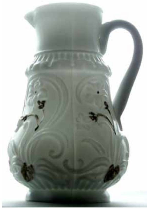
Abb. 2005-3/160 Kanne mit Blumen-Muster opak-weißes Pressglas, goldene Kaltbemalung (Reste) H 22,5 cm, D Mündung 8,5 cm, D Boden zwischen 9 und 11 cm (der Boden ist nicht kreisrund) Sammlung Schaudig Hersteller unbekannt, Frankreich, um 1900