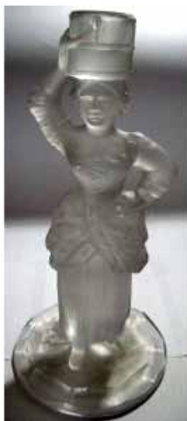
Abb. 2005-1/534 eBay Deutschland, Art.Nr. 2289234982, €31,01 "Frauenfigur auf einem Glassockel ... H mit Sockel ca. 25 cm, D Sockel 13 cm, G 1670 g SG: vgl. MB St. Louis um 1872, Planche ohne Nummer, Leuchter Nr. 13, „Flambeau jardinière mat“ [Gärtnerin]

Auf einer dieser 28 Tafeln ohne Nummern findet man unter den Artikel-Nummern 1 - 19 genau den Figurenleuchter als Gärtnerin in Tracht mit einem Holzeimer als Nr. 13, „Flambeau jardinière mat“!