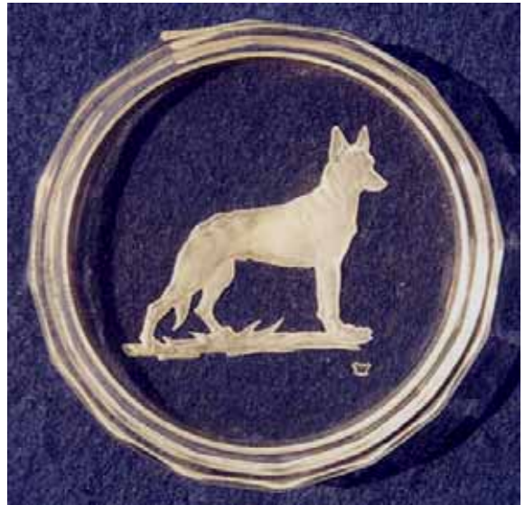
Abb. 2005-3/265 Untersetzer mit Reliefgravur Schäferhund farbloses Pressglas, D 7,2 cm Sammlung Stopfer H. Hoffmann, Gablonz, 1920-er Jahre, sign. Schmetterling