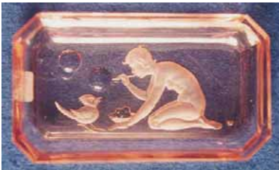
Abb. 2005-3/288 Schale mit Reliefgravur Mädchen mit Vogel farbloses, rosa Pressglas, H 1,7 cm, L 11 cm, B 6,2cm Sammlung Stopfer H. Hoffmann, Gablonz, 1920-er Jahre, sign. Schmetterling s. MB Hoffmann 1927, Tafel xxx, Nr. 185