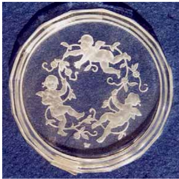
Abb. 2005-3/272 Untersetzer mit Reliefgravur Drei Putten mit Rosen farbloses Pressglas, H xxx cm, D 7,1 cm Sammlung Stopfer H. Hoffmann, Gablonz, 1920-er Jahre, sign. Schmetterling