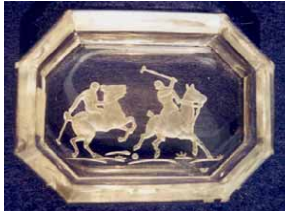
Abb. 2005-3/283 Schale mit Reliefgravur Polospieler farbloses Pressglas, H 1,8 cm, L 6,9 cm, B 5,2 cm Sammlung Stopfer H. Hoffmann, Gablonz, 1920-er Jahre, sign. Schmetterling s. MB Hoffmann 1927, Tafel xxx, Nr. 360