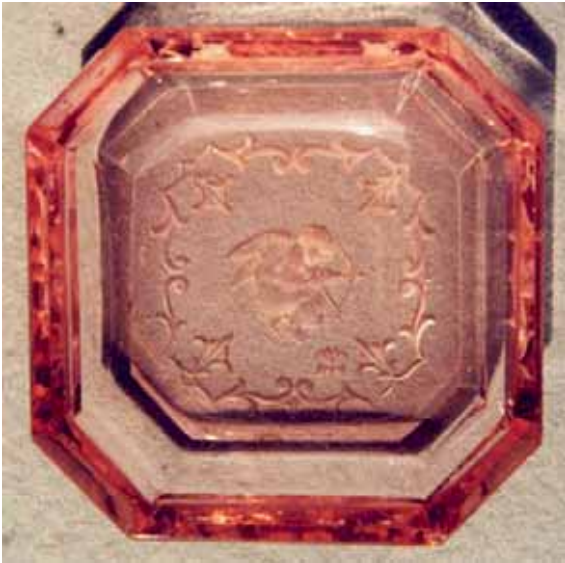
Abb. 2005-3/286 Schale mit Reliefgravur Amor grünes, blaues, rosa Pressgl., H 1,9 cm, L 6,5 cm, B 6,5 cm Sammlung Stopfer H. Hoffmann, Gablonz, 1920-er Jahre, sign. Schmetterling s. MB Hoffmann 1927, Tafel xxx, Nr. 121