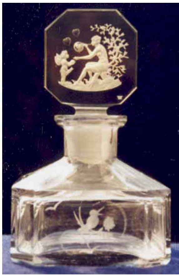
Abb. 2005-3/268 Flakon mit Reliefgravur Amor und Psyche farbloses Pressglas, H 13 cm Sammlung Stopfer H. Hoffmann, Gablonz, 1920-er Jahre, sign. Schmetterling s. MB Hoffmann 1927, Tafel xxx, Nr. 179