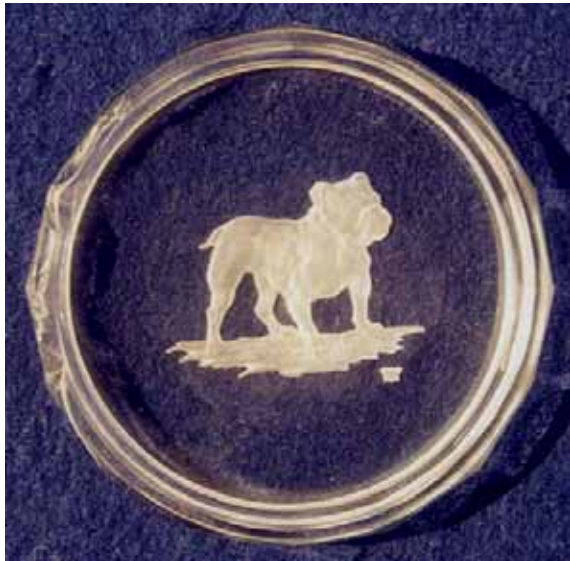
Abb. 2005-3/264 Untersetzer mit Reliefgravur Bulldogge farbloses Pressglas, D 7,2 cm Sammlung Stopfer H. Hoffmann, Gablonz, 1920-er Jahre, sign. Schmetterling