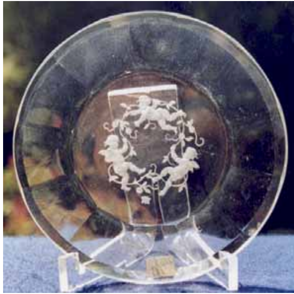
Abb. 2005-3/272 Untersetzer mit Reliefgravur Drei Putten mit Rosen farbloses Pressglas, H xxx cm, D 7,1 cm Sammlung Stopfer H. Hoffmann, Gablonz, 1920-er Jahre, sign. Schmetterling