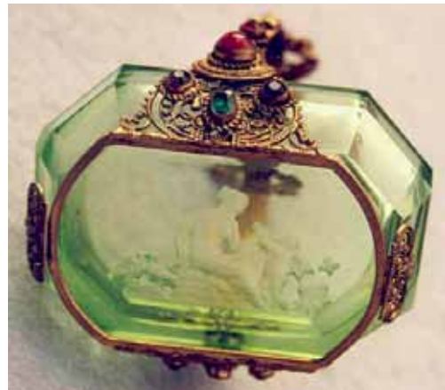
Abb. 2005-3/290 Schale mit Reliefgravur Frau mit Amor (von unten) Metallmontierung, Glassteine und Emaille grünes Pressglas, H 2 cm, L 7 cm, B 5,1 cm Sammlung Stopfer H. Hoffmann, Gablonz, 1920-er Jahre, sign. Schmetterling s. MB Hoffmann 1927, Tafel xxx, Nr. 33