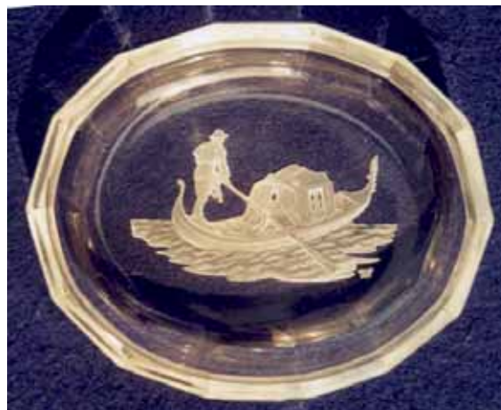
Abb. 2005-3/278 Schale mit Reliefgravur Gondoliere farbloses Pressglas, H 2 cm, L 9,2 cm, B 7,4 cm Sammlung Stopfer H. Hoffmann, Gablonz, 1920-er Jahre, sign. Schmetterling