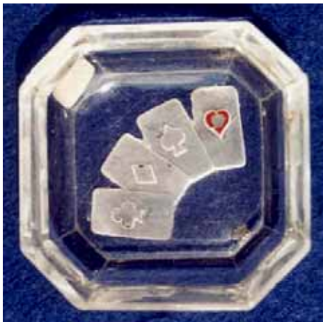
Abb. 2005-3/281 Schale mit Reliefgravur Spielkarten farbloses Pressglas, H 1,7 cm, L 6,4 cm, B 6,4 cm Sammlung Stopfer H. Hoffmann, Gablonz, 1920-er Jahre, sign. Schmetterling s. MB Hoffmann 1927, Tafel xxx, Nr. 234