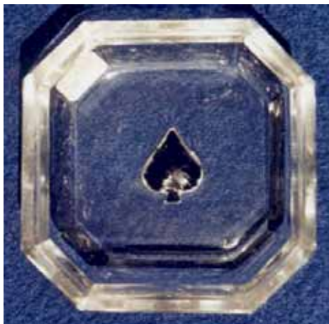
Abb. 2005-3/282 Schale mit Reliefgravur Spielkartensymbol Pik farbloses Pressglas, H 1,7 cm, L 6,4 cm, B 6,4 cm Sammlung Stopfer H. Hoffmann, Gablonz, 1920-er Jahre, sign. Schmetterling s. MB Hoffmann 1927, Tafel xxx, Nr. 192