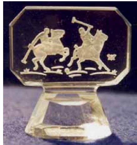
Abb. 2005-3/284 Gluttöter mit Reliefgravur Polospieler farbloses Pressglas, H 4,2 cm, B 3,9 cm Sammlung Stopfer H. Hoffmann, Gablonz, 1920-er Jahre, sign. Schmetterling