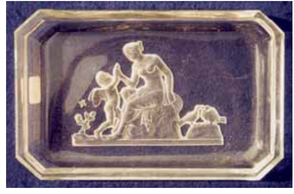
Abb. 2005-3/290 Schale mit Reliefgravur Frau mit Amor (von unten) Metallmontierung, Glassteine und Emaille grünes Pressglas, H 2 cm, L 7 cm, B 5,1 cm Sammlung Stopfer H. Hoffmann, Gablonz, 1920-er Jahre, sign. Schmetterling s. MB Hoffmann 1927, Tafel xxx, Nr. 33