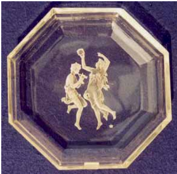
Abb. 2005-3/275 Schale mit Reliefgravur Tanzende mit Musikant farbloses Pressglas, H 2,5 cm, D 14,4 cm Sammlung Stopfer H. Hoffmann, Gablonz, 1920-er Jahre, sign. Schmetterling s. MB Hoffmann 1927, Tafel 35, Nr. 23