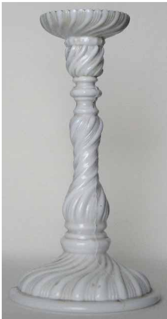
Abb. 2005-4/106 Leuchter mit verdrehten Walzen opak-weißes, stempel-gepresstes Glas, H 21,7 cm, D oben 6,8 cm, D unten 11,8 cm, Gewicht 400 gr Sammlung Schaudig Vereinigte Radeberger Glashütten Actiengesellschaft, Radeberg in Sachsen, um 1890 s. MB Radeberg 1890, Tafel 37, Leuchter Nr. 3703

Für mich sieht es so aus, als wäre der Schaft nach dem Pressen ab der Mitte gedreht worden, denn die Pressnaht geht nicht gerade nach oben - ich weiß nicht, ob das auf den Fotos so erkennbar ist. Das Oberteil ist vielleicht extra gepresst und angesetzt worden, die Nähte sind versetzt - oder es ist mal abgebrochen und geklebt.