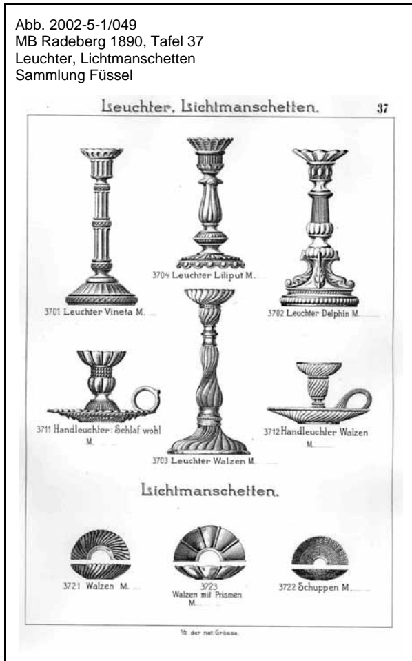
Abb. 2002-5-1/049 MB Radeberg 1890, Tafel 37 Leuchter, Lichtmanschetten Sammlung Füssel

Wegen des Musters hätte ich den Leuchter am ehesten nach Frankreich, vor 1900, eingeordnet. Das Muster heißt deutsch „gedrehte Walzen“, französisch „bambous tors“ und englisch „swirling gadroons“. Das Dekor war vor allem bei französischem Pressglas weit verbreitet. Man hätte es wegen der untragbaren hohen Arbeitskosten nicht ohne Pressen herstellen können. Das Muster Ihres Leuchters ist wegen der 3 feinen Rillen zwischen den Rundrippen, den „Walzen“, eine interessante Variante der Urform.