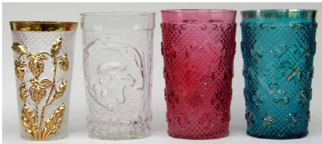
Abb. 2005-4/152 (siehe auch Abb. 2003-2/236)

Becher mit Erdbeeren, form-geblasenes, farbloses Glas mit Vergoldung, H 10,7 cm, D 6,2 cm, Sammlung Geiselberger, PG-946