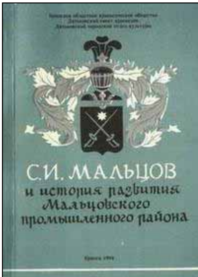
Abb. 2006-3/076 Museum für Kristallglas in Dyatkovo, Veröffentlichung 2000 Sergey Ivanovich Maltsov ... [С. И. Мальцов] aus http://www.dcrystal.ru/html/eng/museum.php

Abb. 2006-3/075 Museum für Kristallglas in Dyatkovo, Veröffentlichung 1998? Sergey Ivanovich Maltsov ... [С. И. Мальцов] aus http://www.dcrystal.ru/html/eng/museum.php