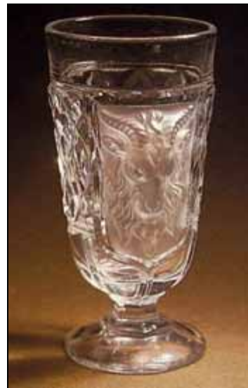
Abb. 2006-3/077 Fußbecher mit Bockskopf und Rauten „Kristallglasfabrik Dyatkovo Mitte 19. Jhdt.“ Bierservice dieser Art wurden um 1870 in St. Louis zunächst aus gepresstem Bleikristallglas hergestellt, ab ca. 1880 aus Glas ohne Bleizusatz aus http://www.dcrystal.ru/html/eng/history.php und http://www.debryansk.ru/~cristalm/index-eng.htm

Die Kristallglasfabrik Dyatkovo wurde Teil eines großen industriellen Reichs, in dem Gusseisen, Eisen, Leinen, Zucker, Wagenbau, Keramikwaren und Glaswaren in den vier benachbarten Provinzen Bryansk, Orel, Kaluga und Smolensk produziert wurden. Die ersten in Russland hergestellten Eisenbahnschienen, Lokomotiven und Schiffsschrauben, die ersten Schmalspurbahnen und die private Telegraphie in Russland wurden von Maltsov hergestellt.