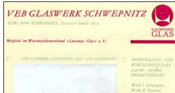
Abb. 2008-1/308 Briefbogen VEB Gaswerk Schwepnitz mit der Übernahme durch Schwepnitz als Betriebsabteilung musste die „Rabima“ ab 1974 die dortigen Briefköpfe verwenden