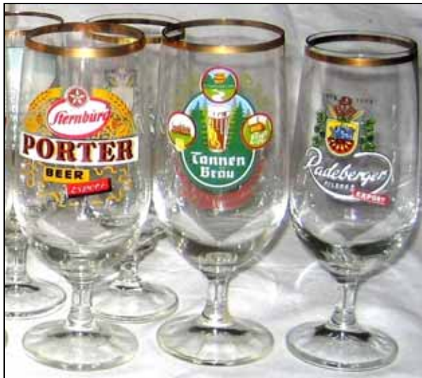
Abb. 2008-1/311 „Rabima“-Biertulpen von Brauereien aus DDR-Zeiten

Der Jahresplan basierte auf den Einzelnormen der Produktionsgrundarbeiten für Tagesleistungen von 500 bis 600 Stück pro Arbeiter für einen Einfarbedruck oder Abziehbild . Natürlich wurde diese Norm ständig überboten. Für einen 5-Farbensiebdruck von 500 bis 700 Gläsern kam eine Wochenarbeitszeit für eine Arbeitskraft zusammen. Für besondere Designs waren manchmal bis zu 8 Einzeldrucke nacheinander erforderlich. Thermoplastische Farben waren für den Handsiebdruck nicht einsetzbar. Gearbeitet wurde mit den Nylon- oder Dederon-Läppchen, kleine handgroße Stoffstücke, die das entsprechende Teilmotiv als Sieb enthielten. In geschickter Handarbeit legten die Frauen diese Siebe auf die Gläser und zogen mit einem Handrakel die Farbe darüber. Die „Rabima“ verarbeitete nur etwa 0,5 % des Rohglasaufkommen an Tulpen und Trinkbechern des VEB Kombines Lausitzer Glas (1980).