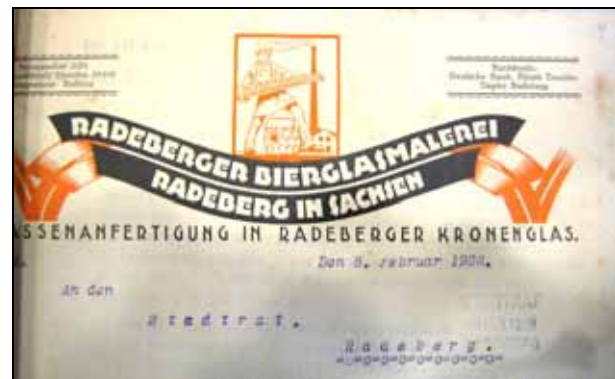
Abb. 2008-1/304 Der neu gestaltete Briefbogen der Radeberger Bierglasmalerei mit dem Glasträger von 1927, Briefbogen vom 8. Feb. 1928

Das Dekorieren von Getränkegläsern aller Art sowie Hohl- und Pressglas durch Auftragen und Einbrennen von Emailfarben und als „2. Standbein“ der Großhandel mit Glas waren die Angaben der Firmenleitung für die Ausführung des Gewerbes.