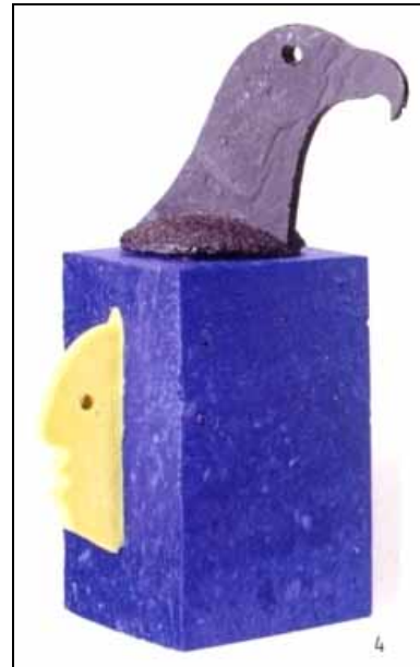
Abb. 2009-1/496 museum kunst palast Bestandsaufnahme 2009 Swinburne, Life Cycles #3, Staffordshire, England, 1992