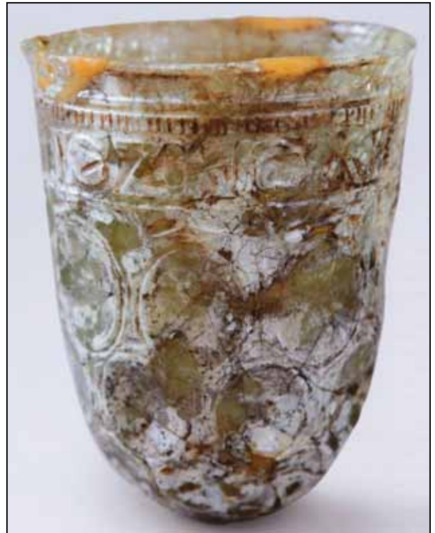
Abb. 2009-1/460 Becher, Kat.Nr. 663 opak-farbiges, marmoriertes Glas, H 18,0 cm, D 14,0 cm Glasbecher aus der Nekropole von Carsium 4. Jahrhundert n. Chr. Muzeul National de Istorie a Românei, Bukarest Inv.Nr. 285876 aus Ausstellungskatalog „Rom und die Barbaren“, S. 149