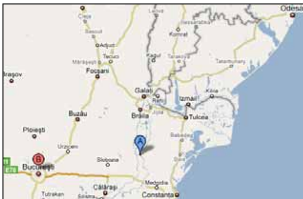
Abb. 2009-1/462 Carsium in Rumänien [Hârşova], „A“ im Ausschnitt Ausschnitt aus GOOGLE MAPS 2008-12

[* Wikipedia: Die Geten waren ein indoeuropäisches Reitervolk des frühen Altertums, das zur weit verbreiteten Stammesgruppe der Thraker gehörte. Nordwestlich der Geten wanderten etwas später die thrakischen Daker ein. Die Daker besiedelten seit dem 5. Jahrhundert v. Chr. die westlichen Schwarzmeergebiete. Sie sind mit den Geten eng verwandt und hatten vermutlich dieselbe Sprache. Erst ab dem 1. Jahrhundert v. Chr. sind beide Stämme vollständig im Daker-Reich vereint. Nach der Unterwerfung durch Kaiser Trajan (reg. 98-117; s. Trajanssäule) umfasste die Römische Provinz Dacia im Wesentlichen das von ihnen bewohnte Gebiet. Diese Provinz reichte aber über das Territorium des heutigen Rumänien hinaus und schloss im Westen Teile der Pannonischen Tiefebene (im heutigen Ungarn und in der Vojvodina) und im Osten auch Teile Moldawiens und Bulgariens ein.]