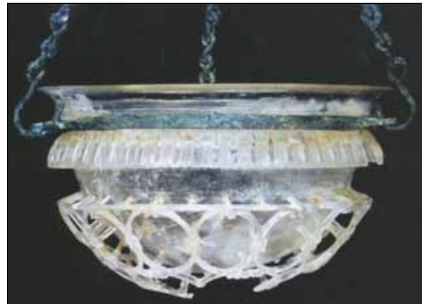
Abb. 2009-1/463 Diatretglas mit originaler Aufhängung Um 300 n.Chr., D 12,1 cm Corning Museum of Glass, Inv.Nr. 87.1.1 aus Lierke / Steckner 1999, S. 114, Abb. 283

Wenn nun diese Diatrete für die Hängung als Lichtgefäß vorbereitet sind, dann sind sie auf untersichtige Durchleuchtung des Korbes hin konzipiert und unter einem anderen Blickwinkel zu sehen als Stand- oder Sturzbecher. Der Korb als „tragende Form“ und der in die Krangenzäsur einfassende Halterung sind formal und funktionell miteinander verbunden. Stellt man die Wirkung der leuchtenden Wein-Öl-Füllung auf die Korbdurchleuchtung in Rechnung, so ergibt selbst der durch dünne Stege vom Gefäßkörper abgesetzte Korb mit seinen Durchbrüchen einen Sinn. Die Zweischichtigkeit wird optisch gesteigert, wenn der Gefäßkörper leuchtet und der umfassende Korb sich in scherschnittartiger Durchbrucharbeit abhebt. [...]