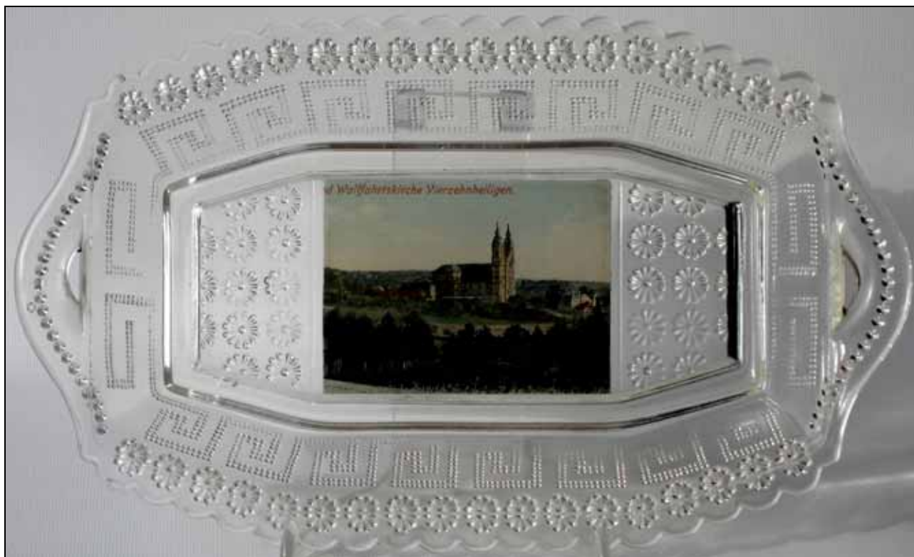
Abb. 2009-1/229 (Maßstab ca. 75 %) Tablett mit Rosetten und Mäander, Foto „Wallfahrtskirche Vierzehnheiligen“ farbloses Pressglas, H 2,7 cm, B 13,2 cm, L 22,1 cm Sammlung Geiselberger PG-1148 s. MB Gebrüder von Streit 1913, Tafel 11, Nr. 13, Teller „Berlin“ oblong mit 2 Griffen, Länge 220 mm