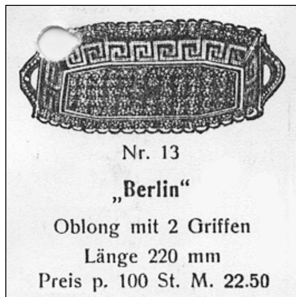
Abb. 2001-1/413 (Ausschnitt) MB Gebrüder von Streit, 1913, Tafel 11, Nr. 13 Teller „Berlin“, Oblong mit 2 Griffen, L 22 cm MB Sammlung Feistner

leur viel länger gebraucht als mit dem Körner. Ein Metallbohrer hat auch heute noch nicht so eine scharfe Spitze wie ein Körner.